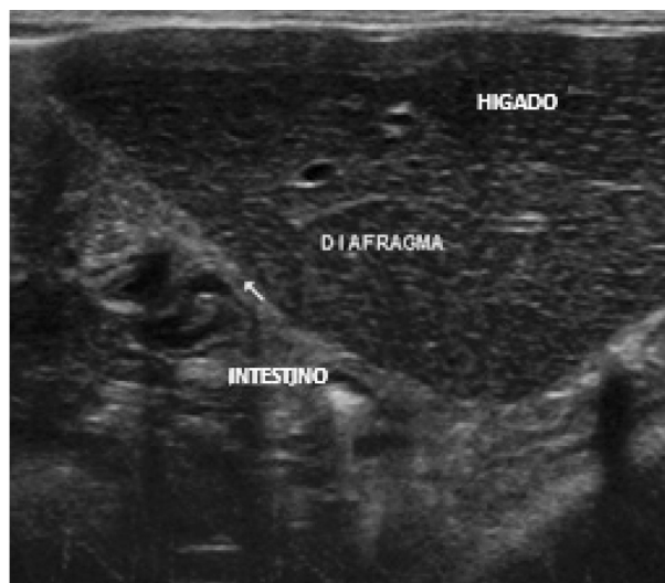
Figura 1. Imagen ecográfica a través de una ventana subxifoidea. Se evidencia presencia de asas intestinales y lóbulos hepáticos en la cavidad torácica. Sonda lineal con Frecuencia 18MHz.

El estudio ecográfico abdominal permitió observar la presencia de vísceras en la cavidad torácica (estómago y yeyuno), pérdida de la continuidad de la línea del diafragma, lo que permitió determinar que el órgano protruido en la hernia inguinal era la vejiga urinaria. De la misma manera, se evidenció disminución en el tamaño de los riñones (31,7 mm de largo) (Figura 1).