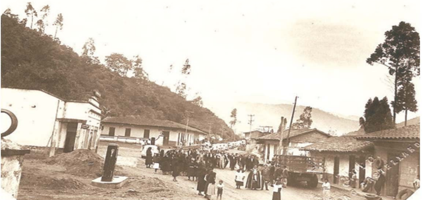
Figura 7. Barrio El Libertador en 1947. Edición propia. Fuente: Revista IMA y Germán Niño.

por campesinos y mineros, quienes se reunían los fines de semana se a departir y formalizar negocios. También amarraban sus bestias en donde hoy se encuentra ubicada la estatua del libertador, con la constante visita de campesinos y viajeros como punto de paso obligado. La plaza de la Hoyada fue consolidándose como una parte importante para las personas que iban hacia la Plaza Bolívar, dirigiéndose por donde hoy se encuentra la carrera segunda o el tobogán de la Gogó, que para entonces era un camino de piedra y a un costado se encontraba ubicado un pedestal, en el que reposaba una estatua