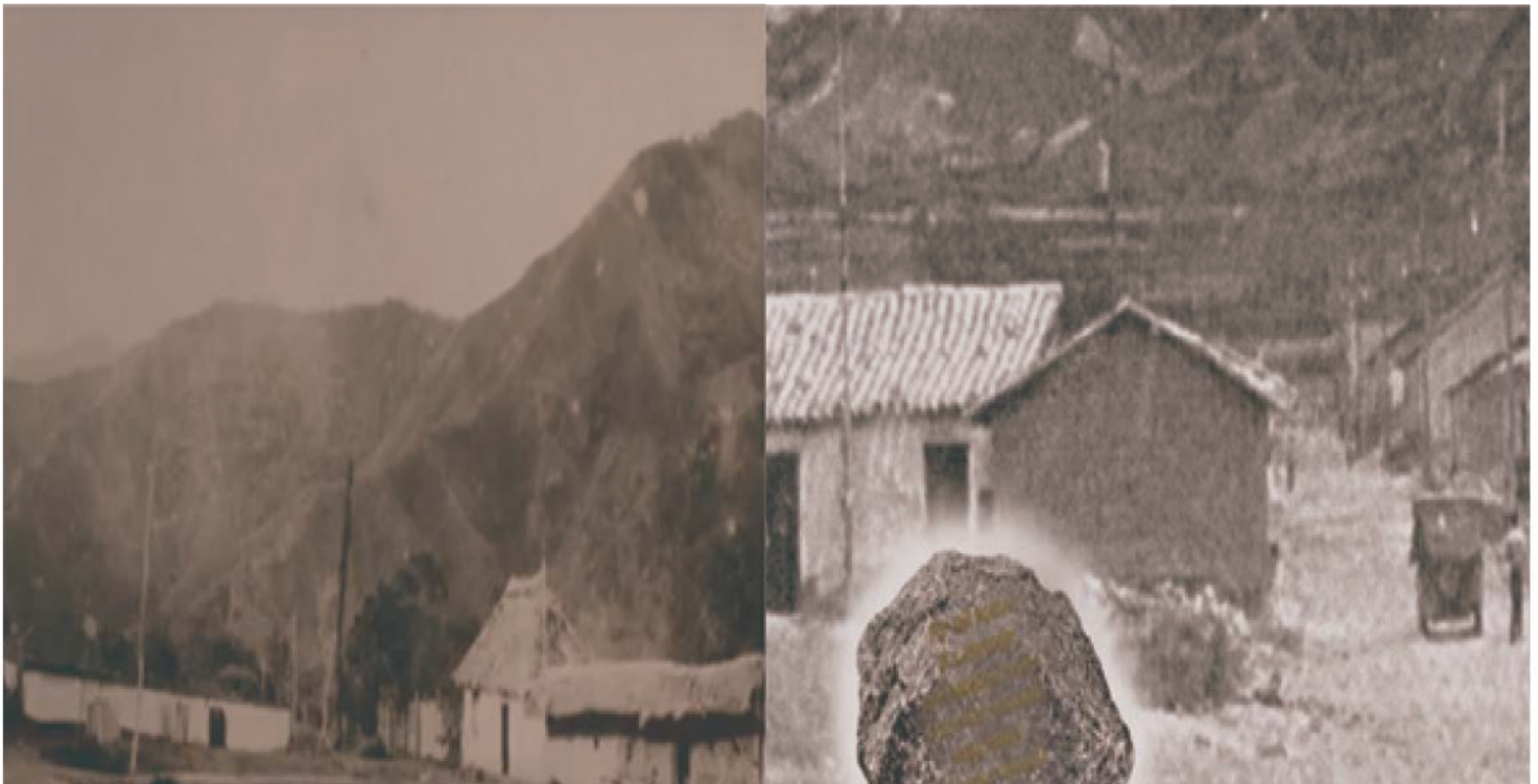
Figura 4. Casas neocoloniales en 1900, edición propia.