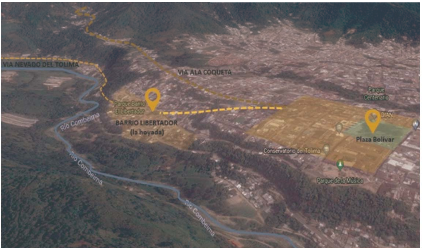
Figura 3 , ubicación del barrio El Libertador sobre río Combeima. Edición propia sobre plano de google earth.

Para 1900, la Hoyada estaba poblada de casas