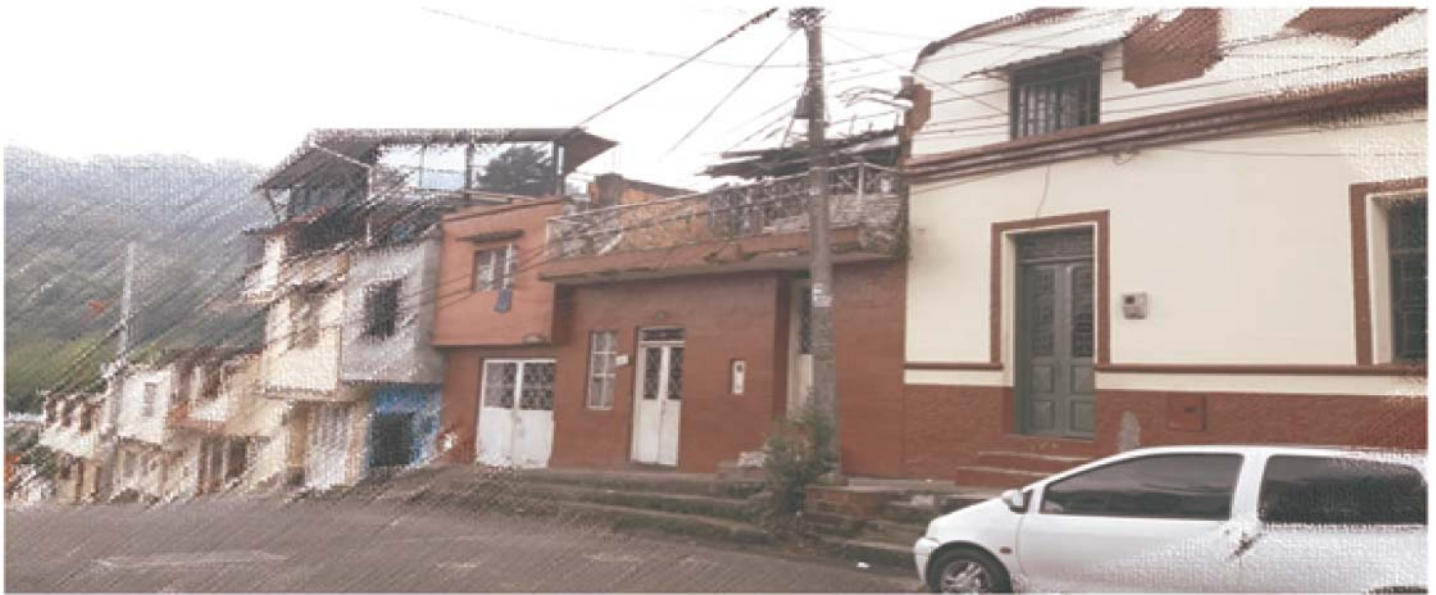
Figura 9. Ubicación de la antigua escuela El Libertador en 1947.

fecha especial. Las familias más recordadas son los Preciado, Chávez, González, Arias y Duela, quienes habitaron desde el principio la Hoyada, hoy conocida como barrio El Libertador.