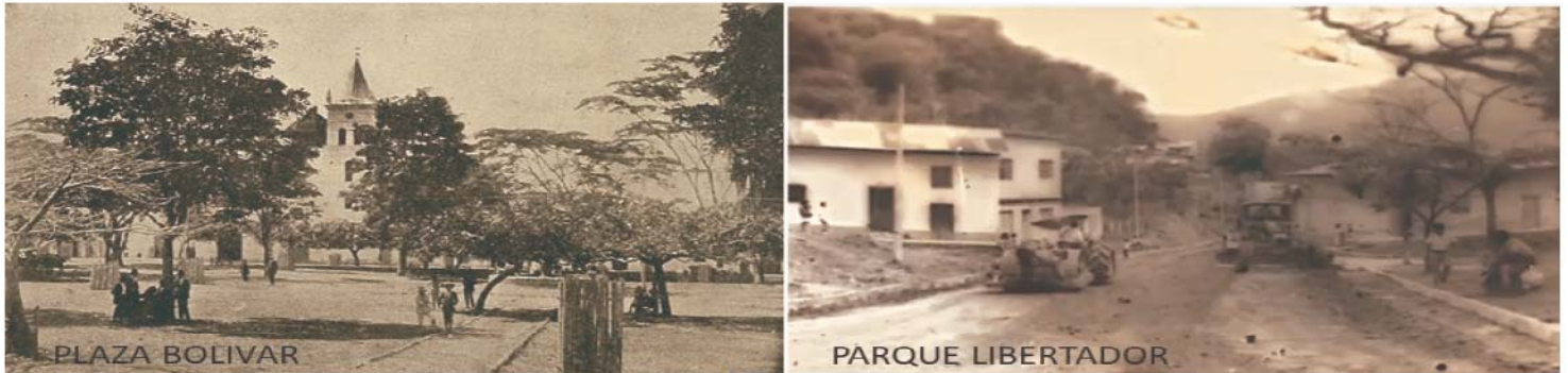
Figura 5 , plaza de Bolívar y parque del Libertador, edición propia. Fuente: Revista IMA y Germán Niño.

perdurado durante el tiempo, y que lleva por nombre “El Libertador” (Gómez, 2013). A conmemoración de la escultura, la fiesta patria el 20 de julio, se ha convertido en una tradición para el barrio, en el cual se realizan diferentes actividades como ofrendas, conciertos marciales y juegos tradicionales..