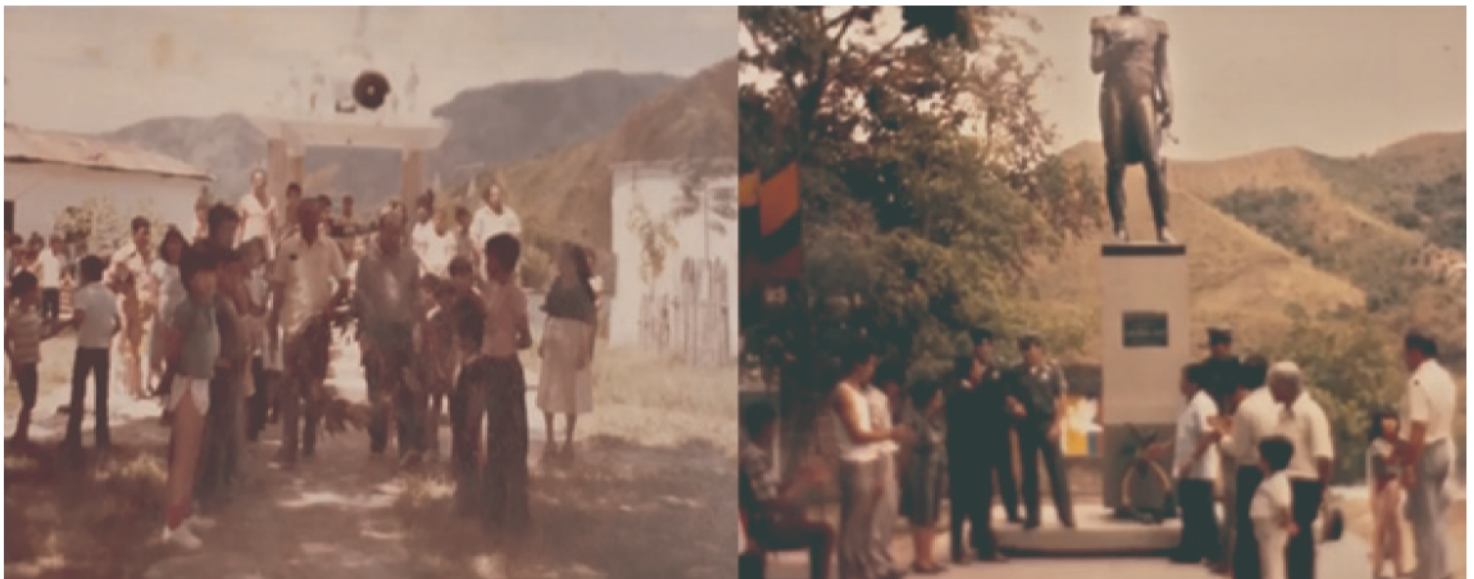
Figura 6 . Conmemoración del 20 de julio en el barrio El Libertador. Edición propia.

Para estos años, la estatua de la plaza El Libertador es remplazada por una de mayor tamaño, ya que la original medía 1.62 (estatura real del libertador). Después de ser remplazada, es abandonada en un garaje de los bomberos de Ibagué. La comunidad decide rescatarla y ubicarla en un punto estratégico,