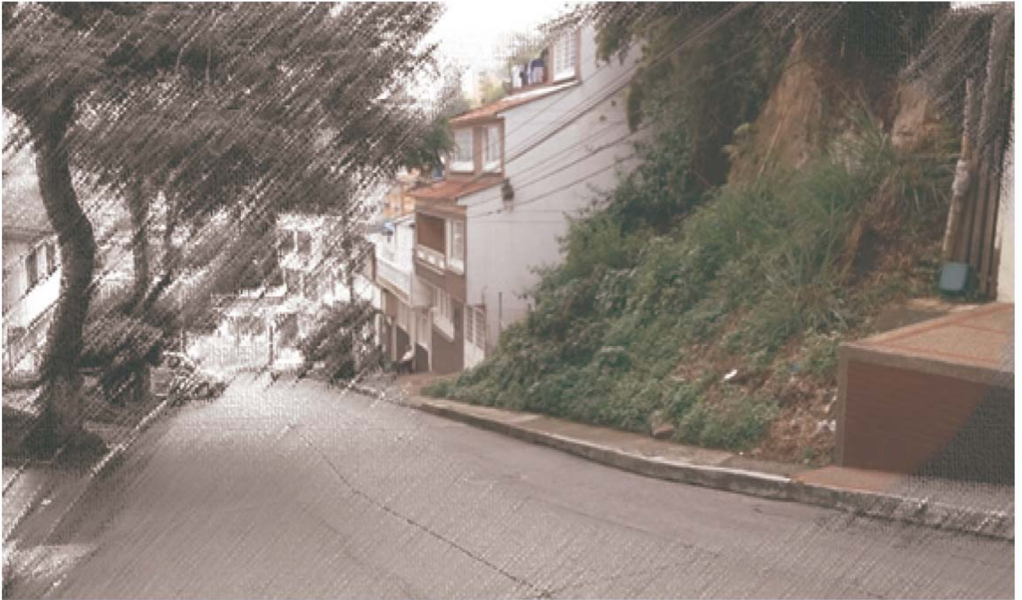
Figura 8. Antigua ubicación de la estatua de la Virgen María vía a la Gogó.

ubicaba al frente. Aquella escuela tenía hasta cuarto de primaria, pero solo duró unos años, ya que luego fue trasladada a la carrera 3 #2A-2 y su nombre