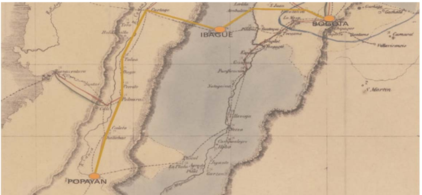
Figura 1. plano conexión vial Bogotá, Ibagué, Popayán. Elaboración propia sobre plano de la biblioteca virtual Banco de la República.

Para 1550, el 14 de octubre, es fundada la ciudad de villa de San Bonifacio de Ibagué del Valle de las