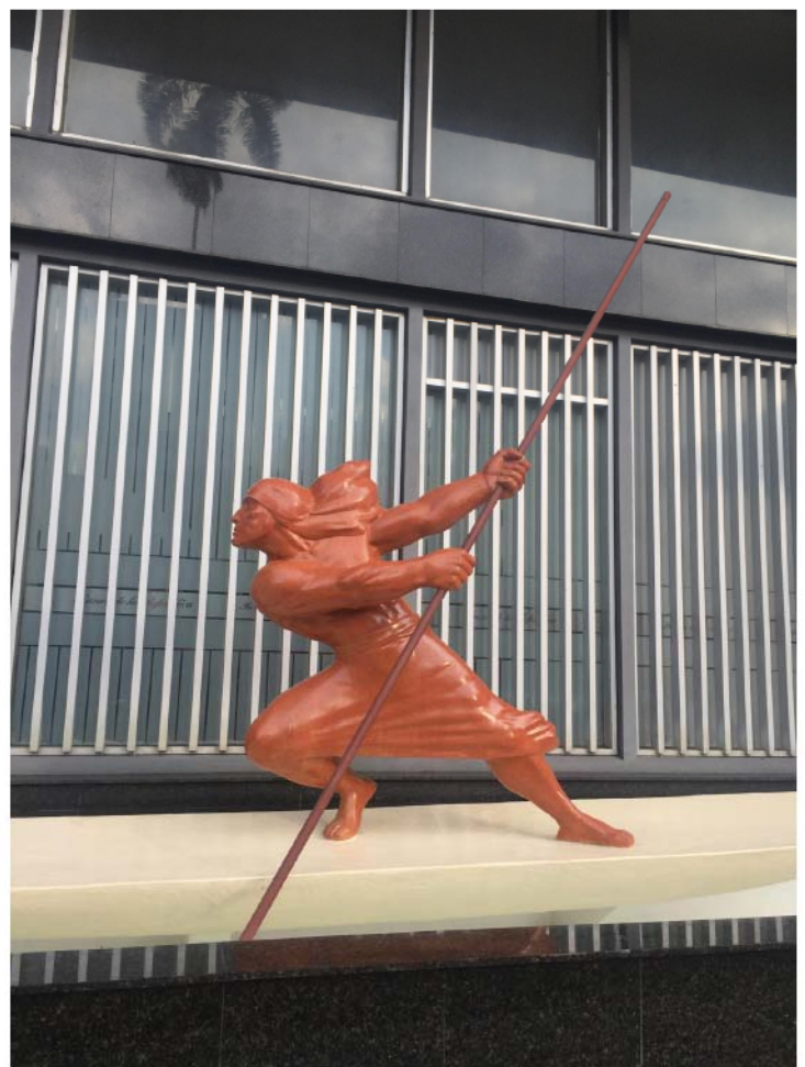
Figure 6 El Boga restaurado (Reyes, 2018) Se muestra un Boga rejuvenecido y revitalizado, después de la intervención generada por el artista Enrique Salazar.

Su trabajo y legado se ha ido dejando en el olvido pues su esplendor y gloria ha ido decayendo a raíz de su muerte; pero El Boga ha sido la excepción a dicha