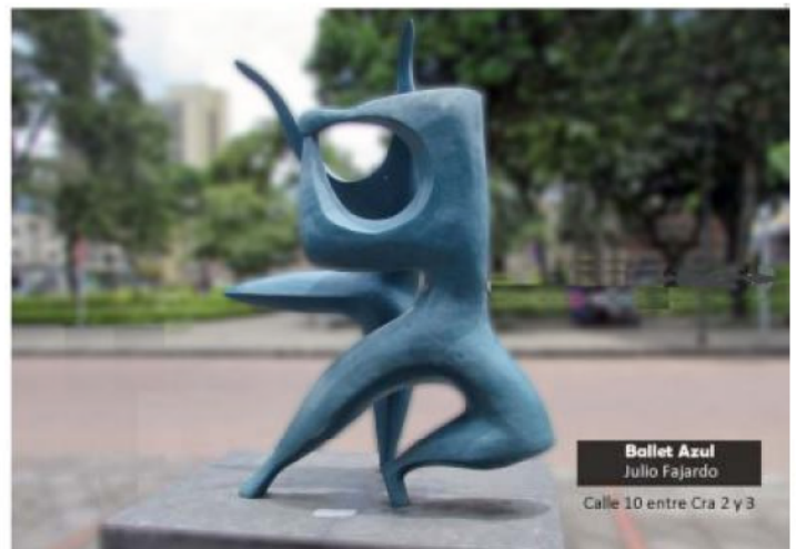
Figure 7 Ballet azul, Escultura de bulto redondo que representa dos figuras