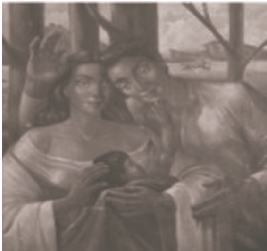
Figure 9: Sintesis, (MAT, 2012) Obra de óleo sobre lienzo por Julio Fajardo. Primer premio en pintura en la exposición Nacional de Medellín en 1955.