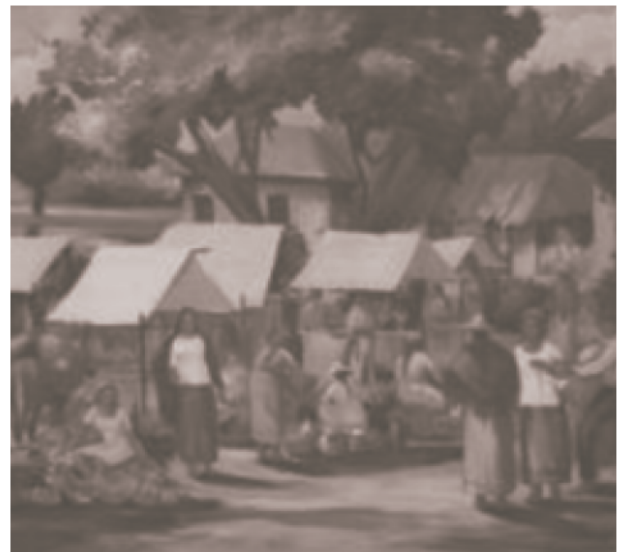
Figure 11: Mercado en Purificación, (MAT, 2012) Obra de óleo sobre lienzo por Julio Fajardo.