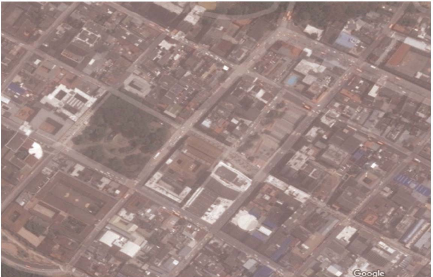
figura 3: Ubicación del Boga (Google maps) La imagen ubica el Boga dentro de la vista satelital del entorno inmediato de la escultura se puede apreciar el Parque Manuel Murillo Toro, La gobernación del Tolima, El Banco de la Republica, La plaza de Bolívar y la Catedral de la ciudad.

Al pintor, escultor y profesor de bellas artes Julio Fajardo le fue otorgada la tarea de complementar y diseñar un elemento complementario al acceso del edificio en 1963, en este mismo año realizó la estatua de Manuel Murillo Toro en cemento bruñido para el