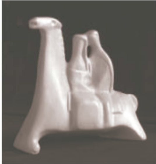
Figure 12: Querencia, (MAT, 2012) Escultura en caolín bruñido por Julio Fajardo.