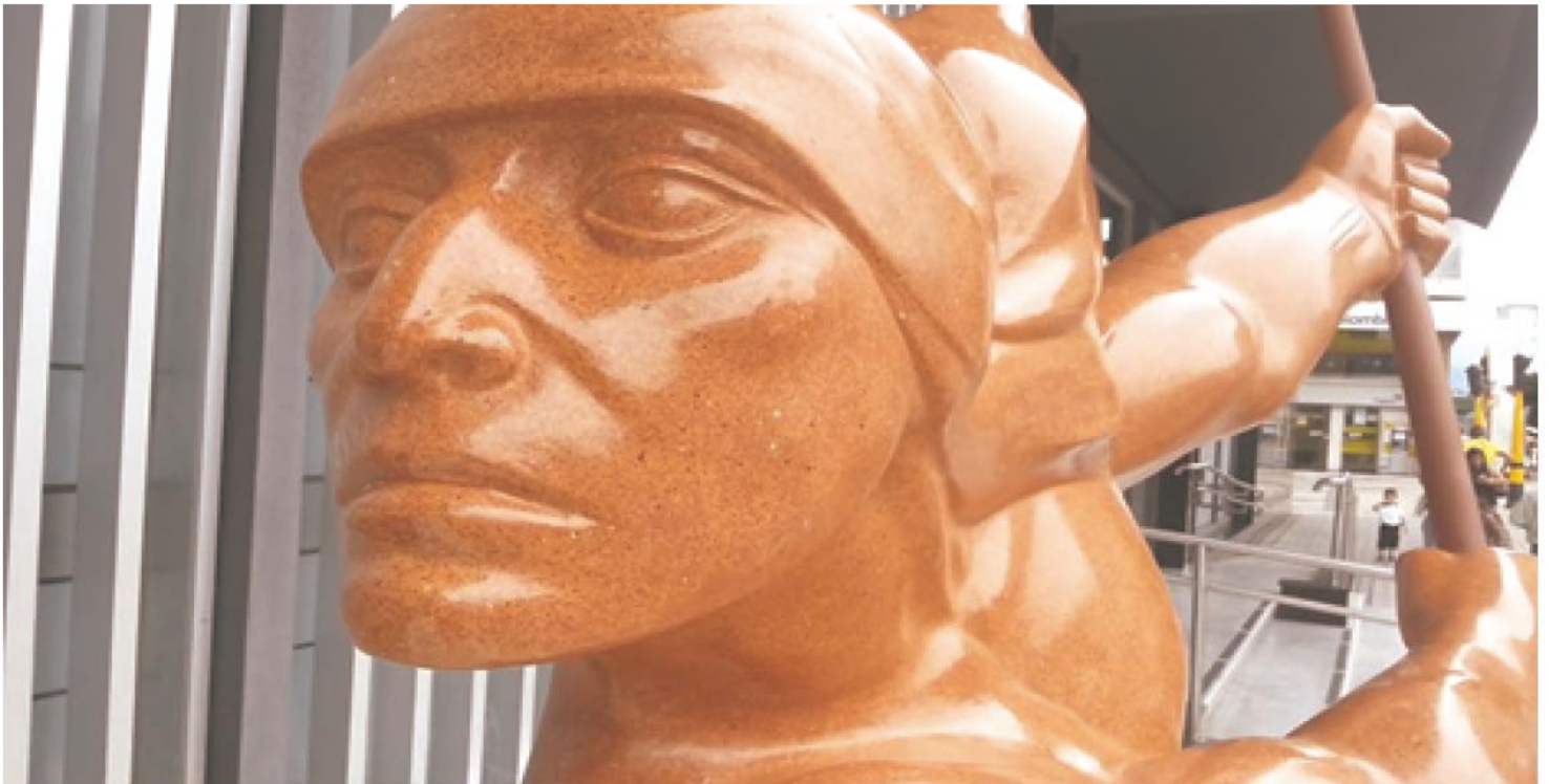
figura 4: Rostro del Boga, (Google images, 2018) Se aprecia con mayor facilidad la expresión y características faciales que el artista emplea para representar al Boga.

El Boga se ha vuelto un ícono muy representativo en la identidad de la ciudad, así mismo del arte local que sirve como representación e ilustración de una leyenda famosa de la región que de una u otra forma ayuda a regionalizar y a hacer propia de la región el