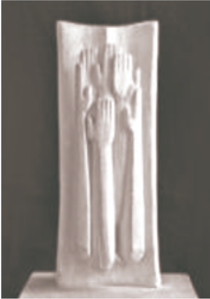
figure 8: Monumento a la paz, (MAT, 2012) Estudio en yeso del monumento a la Paz realizado por Julio Fajardo.