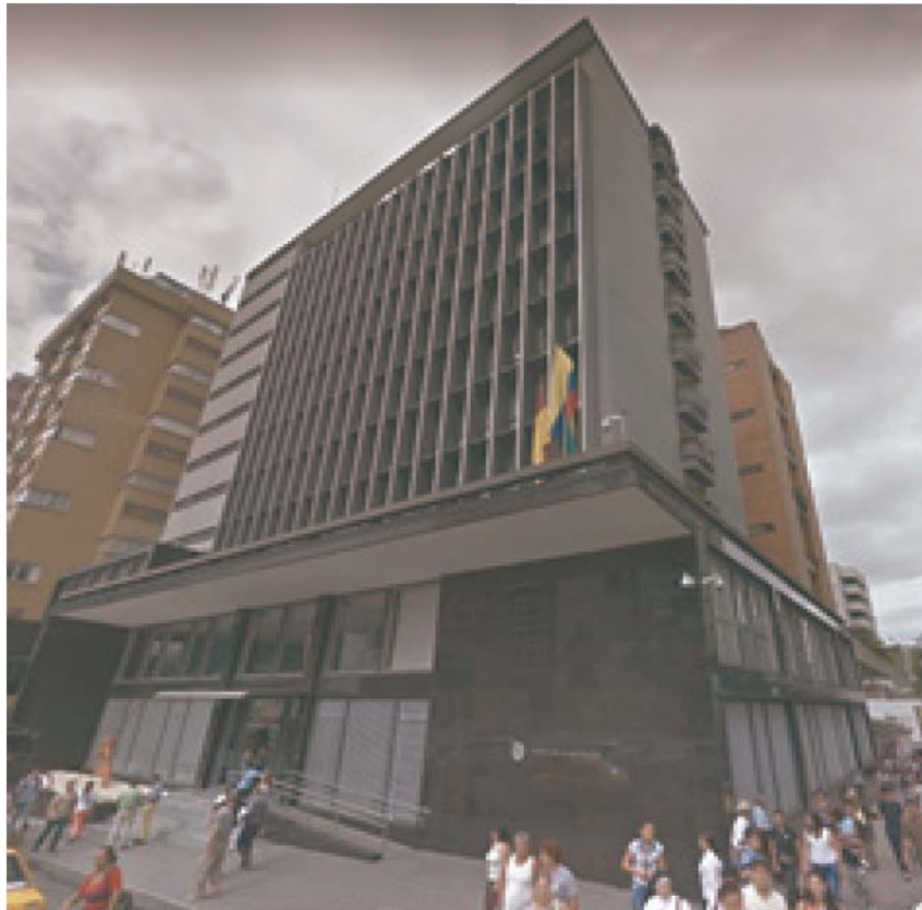
Figure 5 Edificio Banco de la Republica. El complejo bancario con su lenguaje de arquitectura moderna monocromática en cuya planta inferior se encuentra el Boga.

Así como dio un valor al espacio publico de la ciudad