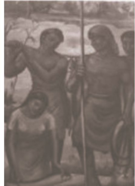
Figure 10: Boga, (MAT, 2012) Obra de óleo sobre lienzo por Julio Fajardo