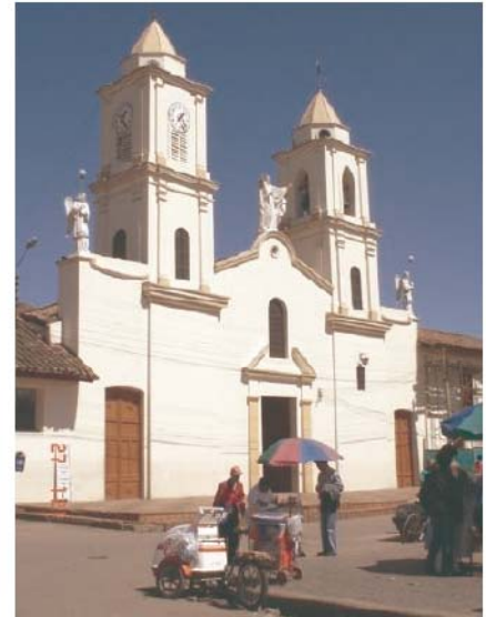
1. Iglesia estado actual.

Se aprecian pequeñas adecuaciones y cambios en el cielorraso y el coro, correspondientes a los años de 1906 y 1930. Tan solo la historia habla de una segunda torre construida en 1944 convirtiéndose en la torre del reloj de la nave lateral izquierda, completando el frontis de la iglesia tal como se admira hoy (Imagen 1), donde se hace necesario tomar decisiones para intervenir la edificación de manera pertinente y respetuosa.