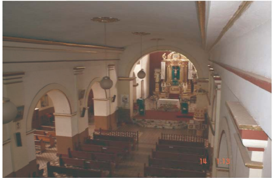
4. Propuesta: sala de conciertos, museo y culto

la opción de una sala de conciertos y un museo en un mismo lugar, con el fin de presentar al feligrés distintas actividades culturales y proyectarlo como un sitio de turismo religioso (imagen 4).