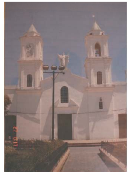
3. Propuesta intervención y restauración.