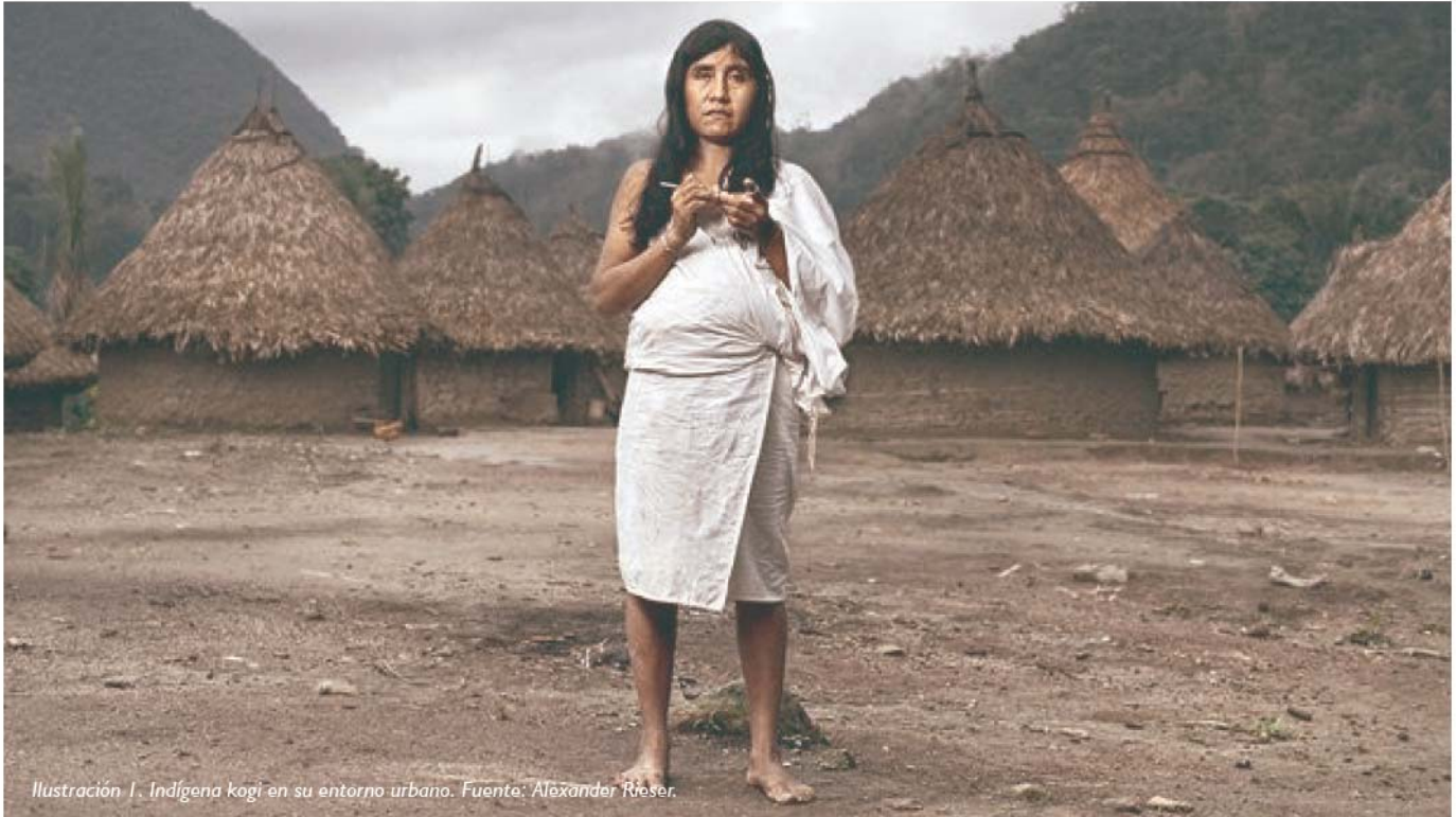
Ilustración 1. Indígena kogi en su entorno urbano.