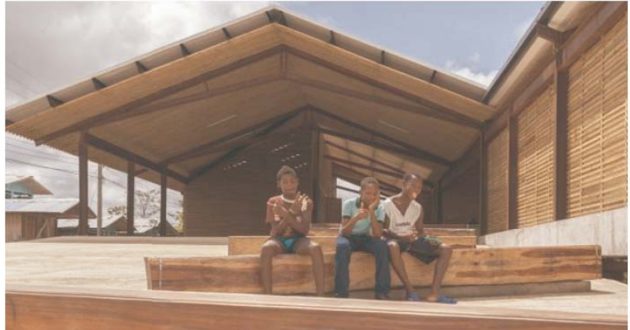
Ilustración 7. Tradición y contemporaneidad en Vigía del Fuerte. Recuperado de http://diarioadn.co/polopoly_fs/1.127560.1412359303!/image/image.jpg_gen/derivatives/p2-1d679x340/image.jpg