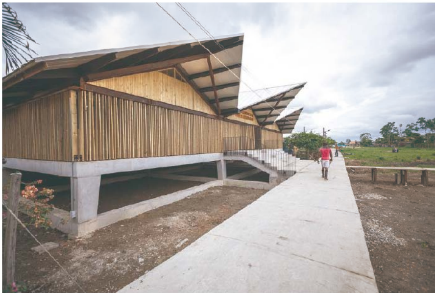
Ilustración 8. Pilotes para conservar las características de los palafitos y exploración en las cubiertas de acuerdo a la arquitectura ancestral.