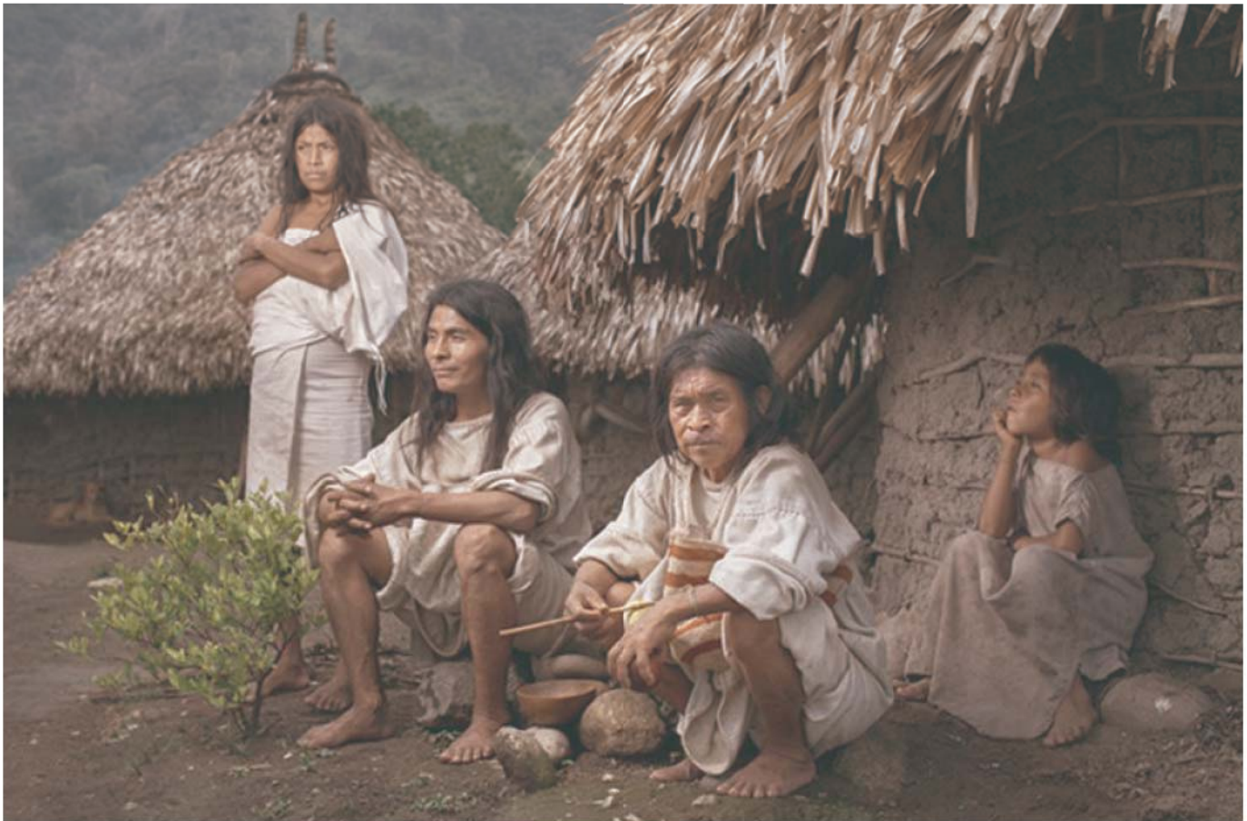
Ilustración 5. Conjunção humana alrededor de la arquitectura vernácula.

y estandarizado, mientras que lo vernáculo es paulatino, experiencial y adaptado a un entorno específico. La arquitectura vernácula es mesurada porque no tiene prisa por figurar en una revista de moda; es cómoda porque su economía no es avara; y es sensible porque resulta de las convicciones espirituales del hombre, no de las relaciones entre la capacidad monetaria y su representación espacial.