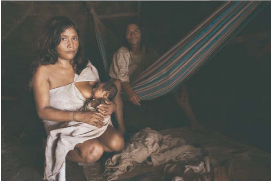
Ilustración 2. Hábitos y patrones de vida en relación con el espacio interior de la vivienda. Fuente: Alexander Rieser.