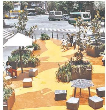
Ilustración 10. Parque de bolsillo en La Condesa, México.

Hoy, la construcción de identidades se realiza a partir de los microrrelatos, de las historias locales, de las narrativas no oficiales. Así se generan discursos que contribuyen a la generación de órdenes nuevos a través de los cuales las regiones y los municipios generan sus propias voces. Parte de esos nuevos discursos son las tendencias del urbanismo estratégico, el cual busca generar soluciones específicas para problemáticas modestas, en lugar de buscar grandes discursos a problemas enormes cuyas soluciones generan mayor caos, al modo de los parques de bolsillo.