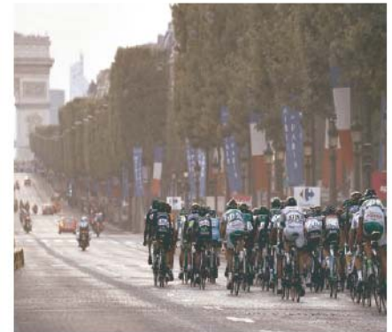
Ilustración 5. Última etapa Tour de Francia año 2013. Pasando por la avenida de los Campos Elíseos, al fondo el Arco del Triunfo.

como el Tour de Francia (Le Tour de France), cuya última etapa acontece atravesando la avenida de los Campos Elíseos y los jardines de las Tullerías, hasta arribar al Arco del Triunfo.