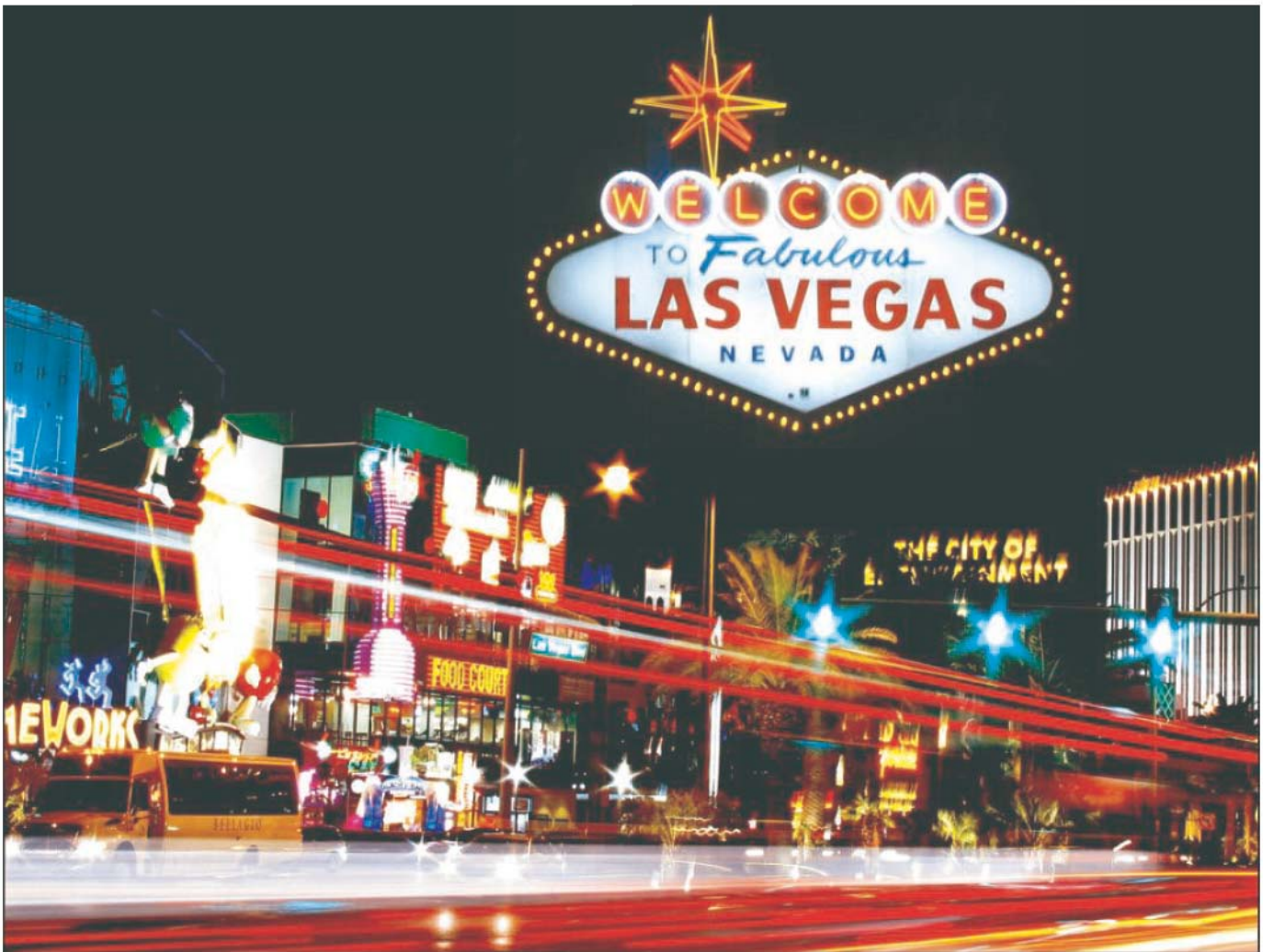
Ilustración 1. Las Vegas. Arquitectura del placer y la diversión.