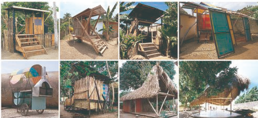
Ilustración 11. Diseño participativo en Palomino, Guajira, realizado por estudiantes de la Universidad Javeriana. Recuperado de http://farm8.staticflickr.com/7072/7339402100_239369f908.jpg

más allá de los tradicionales hitos con enormes presupuestos. Uno de estos ejemplos es el Proyecto de investigación Medio ambiente saludable y vivienda digna en el corregimiento de Palomino, Departamento de la guajira, Colombia , realizado por la Universidad Javeriana, cuyo propósito consistió en partir desde el “presupuesto social” para acercar a los estudiantes de arquitectura a los lugares en que nunca antes pensaron trabajar.