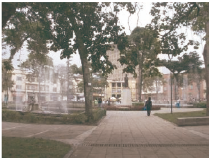
Ilustración 6. Plaza de Bolívar.

Así como sucede en París, cada ciudad tiene sus hitos, los cuales refuerzan la importancia de los eventos realizados. En el caso de