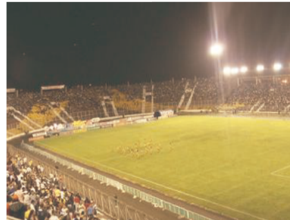
Ilustración 7. Interior estadio Manuel Murillo Toro.

Ibagué, la Carrera Tercera es el eje urbano a lo largo del cual emergen el edificio de la Caja Agraria, la Plazoleta Dario Echandía, el parque Murillo Toro, la Gobernación, la Catedral y la Plaza Bolívar, hitos donde cualquier