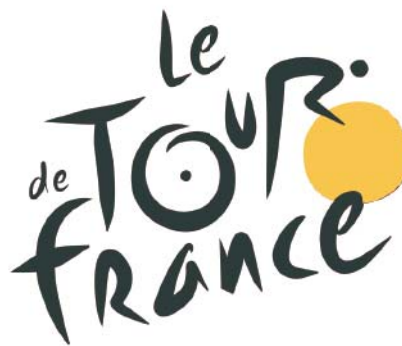
Ilustración 4. Logo Tour de Francia (Le Tour de France).

Son tan importantes los hitos parisinos nombrados que, aparte de ser utilizados como puntos de referencia para las labores cotidianas, muchos eventos adquieren máxima relevancia al ser realizados allí,