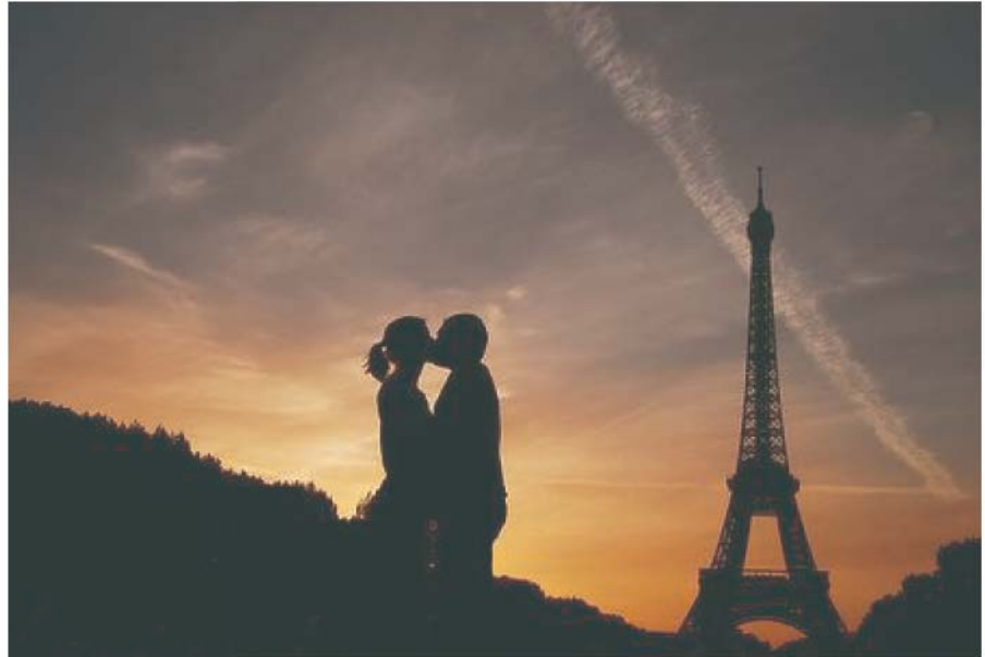
Ilustración 2. París. La ciudad como pretexto para el amor.

Como complemento de las edificaciones, muchos son los elementos urbanos que se pueden volver puntos de encuentro o de ubicación en un sector, como