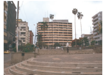
Ilustración 8. Parque Murillo Toro.

ibaguereño se siente identificado. Y cómo olvidar el Estadio Manuel Murillo Toro, el Parque Deportivo y las Piscinas Olímpicas, puntos deportivos de referencia para la ciudad.