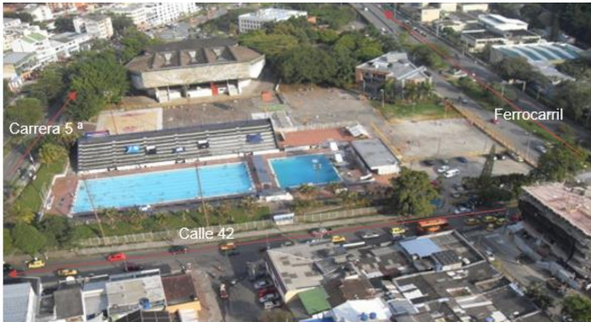
Figura 7. Entorno.