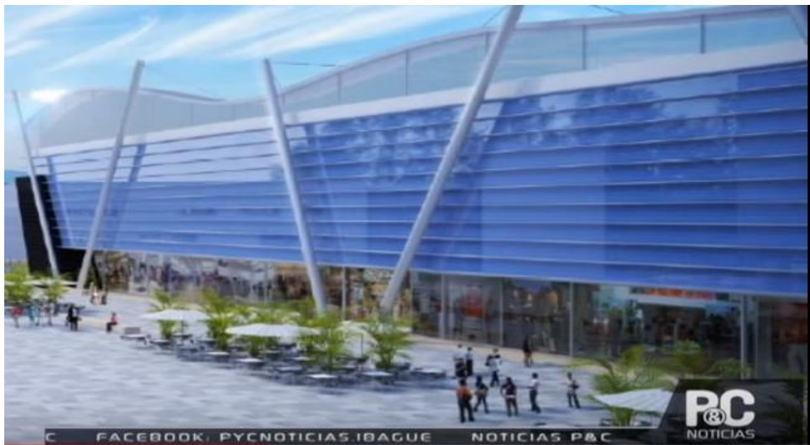
Figura 10. Propuesta grupo TYPSA de la Estación Deportiva Hernando Arbeláez Jiménez de la calle 42.