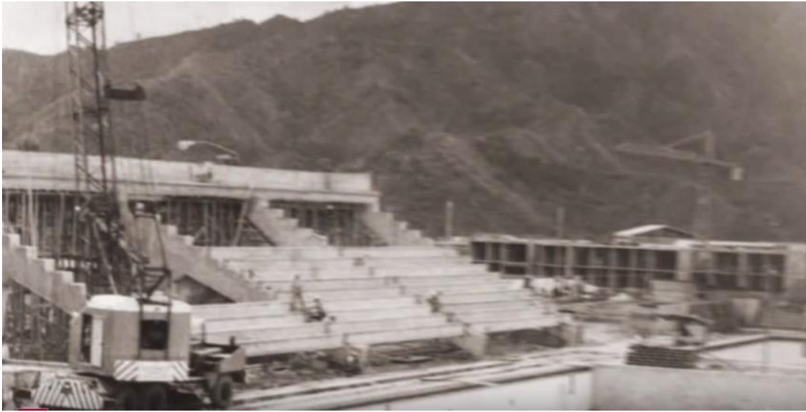
Figura 1. Estación Deportiva Hernando Arbeláez Jiménez de la calle 42, zona de gradería.