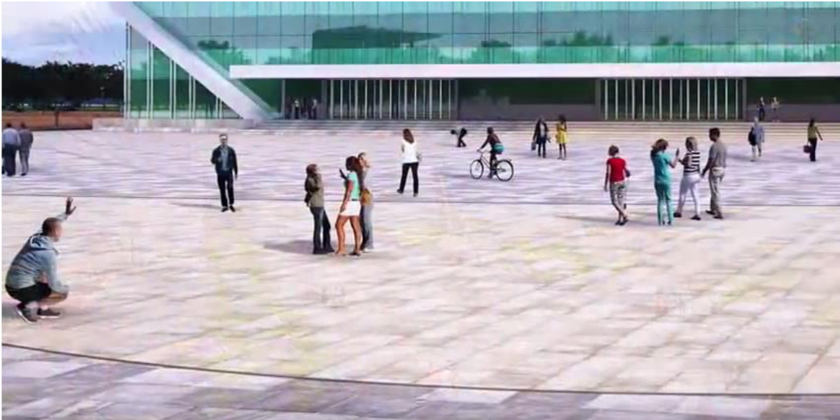
Figura 11. Propuesta grupo TYPSA de la Estación Deportiva Hernando Arbeláez Jiménez de la calle 42.