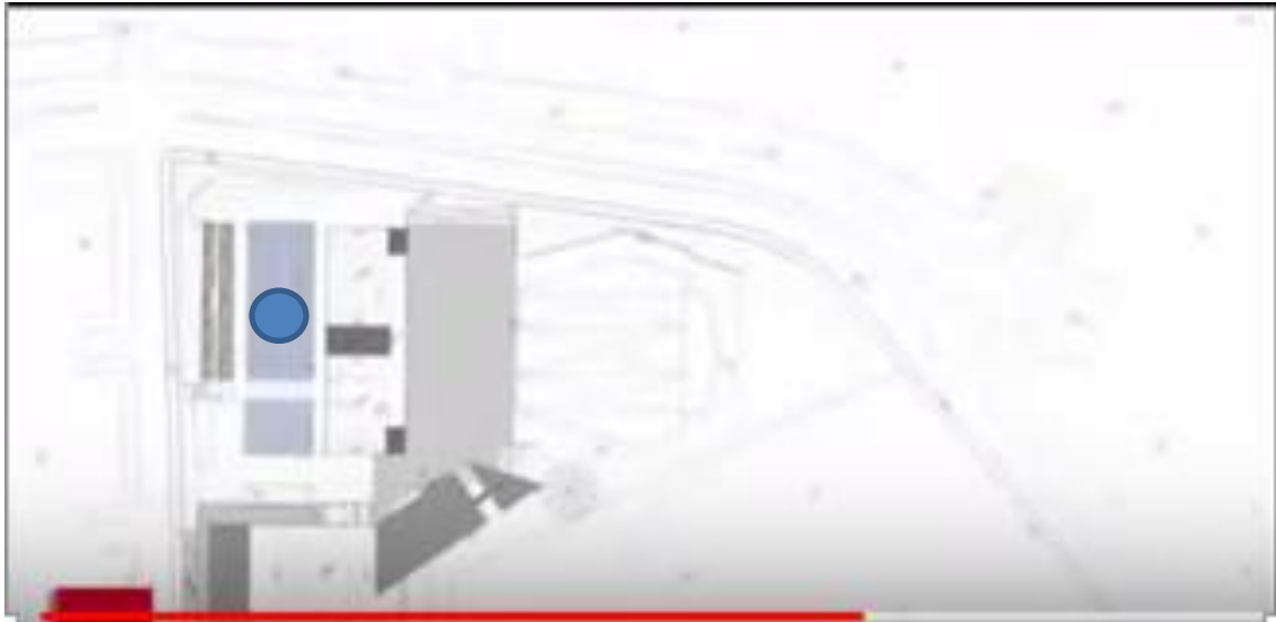
Figura 5. Propuesta grupo TYPESA de la Estación Deportiva Hernando Arbeláez Jiménez de la calle 42.