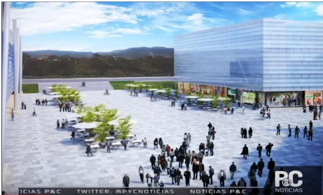
Figura 8. Propuesta grupo TYPESA de la Estación Deportiva Hernando Arbeláez Jiménez de la calle 42.