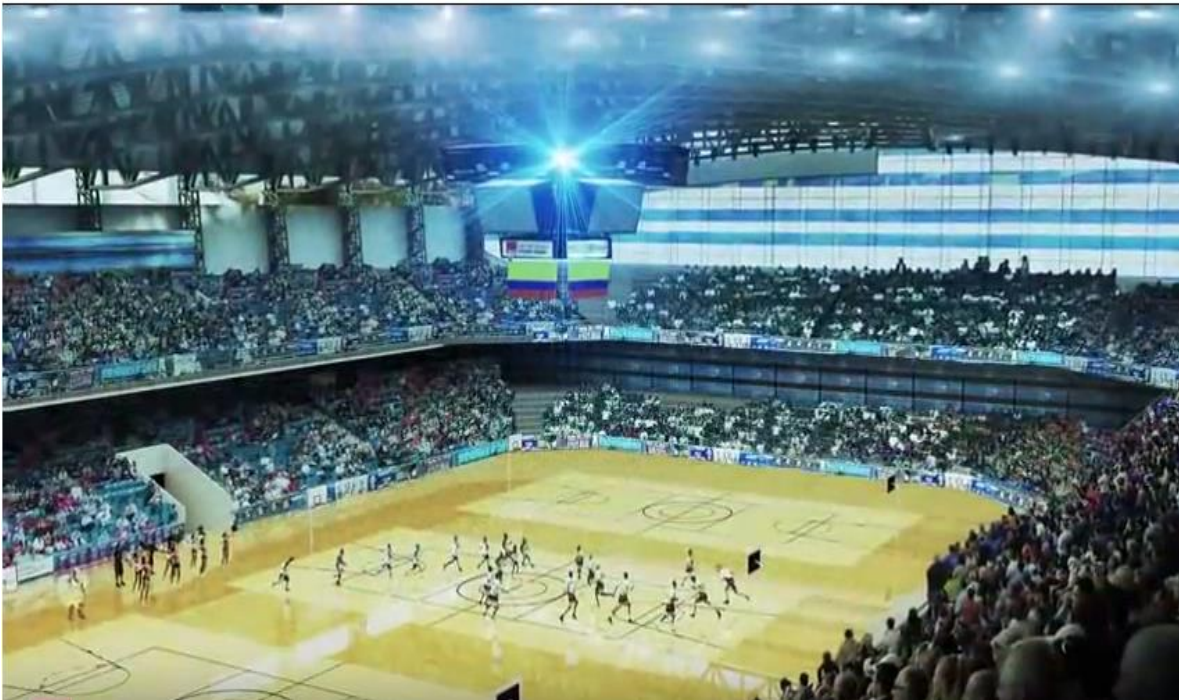
Figura 12. Propuesta grupo TYPESA de la Estación Deportiva Hernando Arbeláez Jiménez de la calle 42.