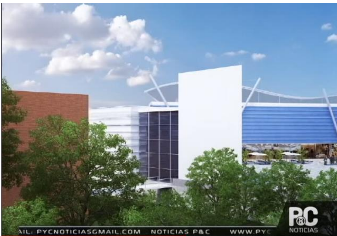
Figura 13. Propuesta grupo TYPESA de la Estación Deportiva Hernando Arbeláez Jiménez de la calle 42.