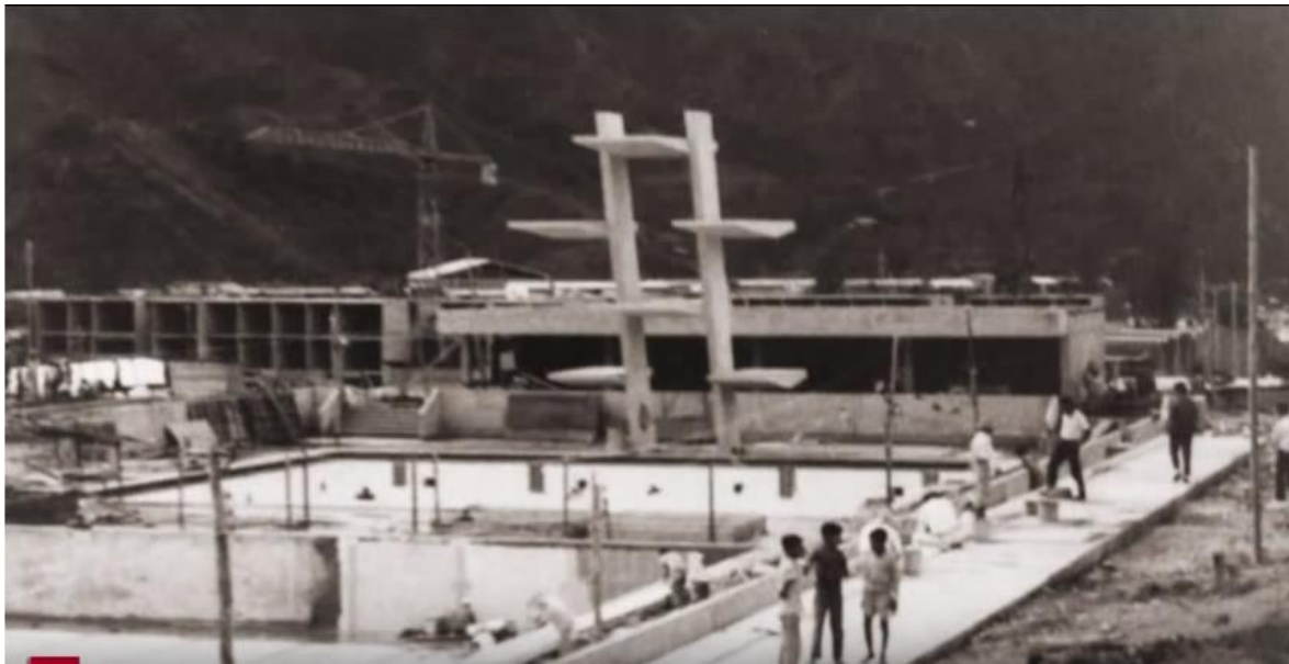
Figura 2. Estación Deportiva Hernando Arbeláez Jiménez de la calle 42, zona del trampolín. Fuente: Alcaldía de Ibagué. (1970).