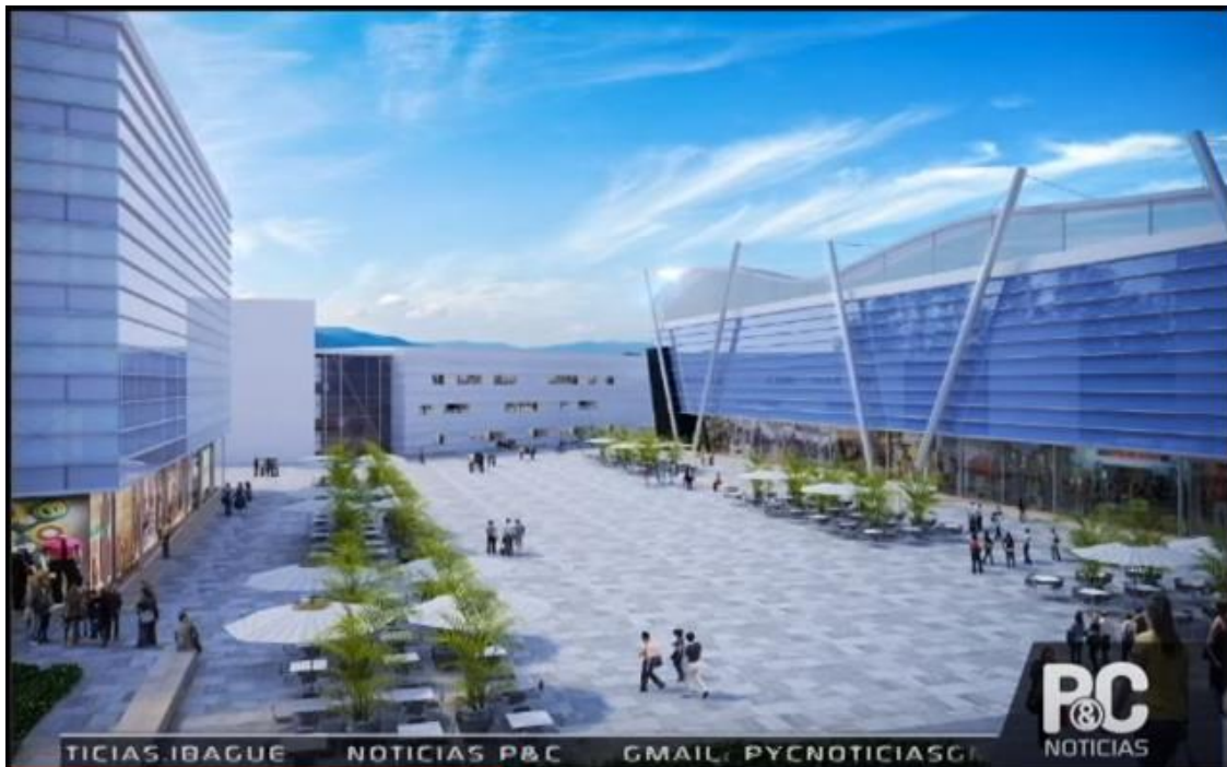
Figura 9. Propuesta grupo TYPESA de la Estación Deportiva Hernando Arbeláez Jiménez de la calle 42.