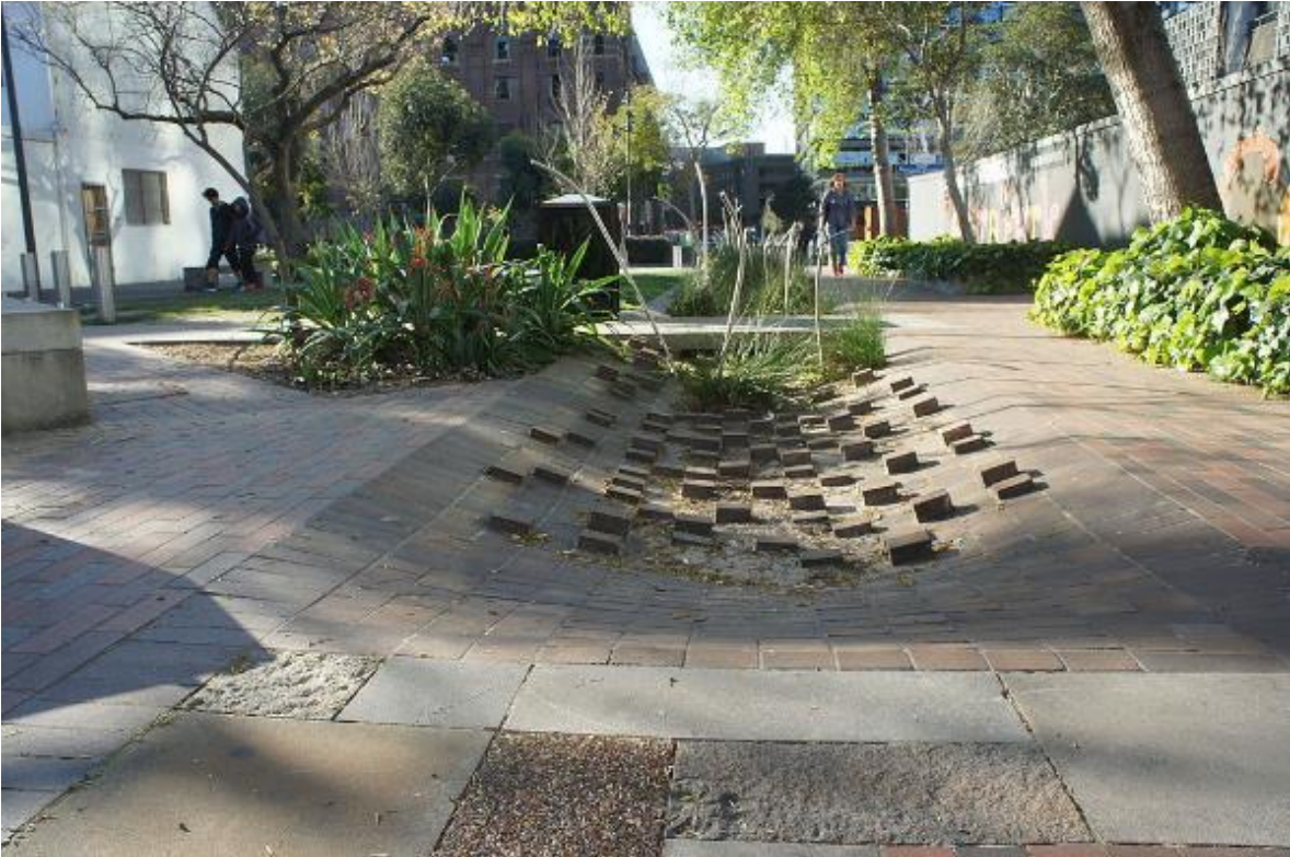
Figura 23. Balfour street pocket park. El rasgo de ladrillo que reduce el flujo de agua y captura cualquier basura.

Este sin dudas es uno de los mejores ejemplos por varias razones, la comunidad participo para poder desarrollar el proyecto, también el uso de materialidad y diferentes especies de plantas adecuadas al lugar, la rehabilitación y valoración paisajística que armoniza con su entorno el tipo de mobiliario, no necesariamente un proyecto o un parque tiene que ser llamativo u ostentoso con la sencillez también se logra llamar la atención y que mejor que el equilibrio entre lleno y vacío.