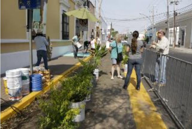
Figura 10. Parque Alegre, Culiacán, México - ejemplo en tierra.