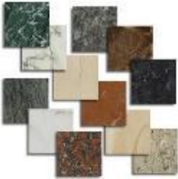
Figura 13. Baldosas pétreas.

Caucho en rollo. Piso aplanado en rollo. Antideslizante, no tóxico y ecológico. Reciclado y reciclable, con un espesor mínimo recomendado de 30 mm.