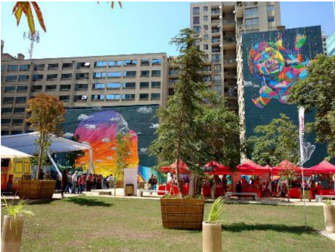
Figura 24. Plaza de Bolsillo de Santiago.

Durante la inauguración de este nuevo espacio público, el intendente metropolitano, Claudio Orrego, destacó que las Plazas de Bolsillo son una “iniciativa barata, sencilla, pero muy potente”.