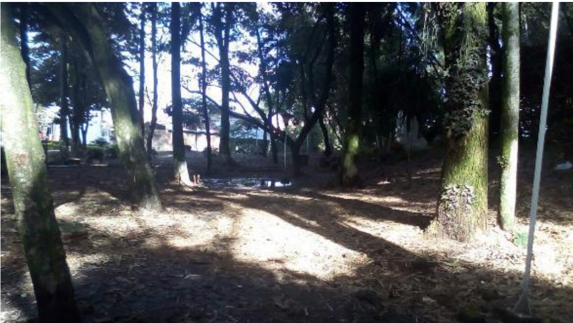
Figura 3. Lote que servirá para el parque de bolsillo.