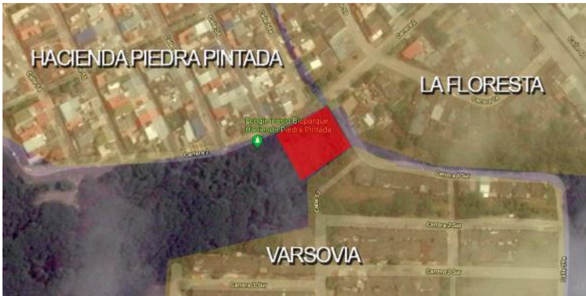
Figura 1. Representación grafica de los barrios y la unión con el lote.

Esto ocurre en el cruce de 3 barrios Cra segunda y cra 1 sur ( Hacienda piedra pintada hacia el noroccidente, La Floresta al noroeste, Varsovia al sur ).