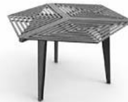
Diseño: Ariel Rojo

Color: negro , gris grafito, verde claro, azul cielo, naranja