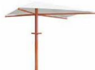
Figura 19. Elementos de sombra.