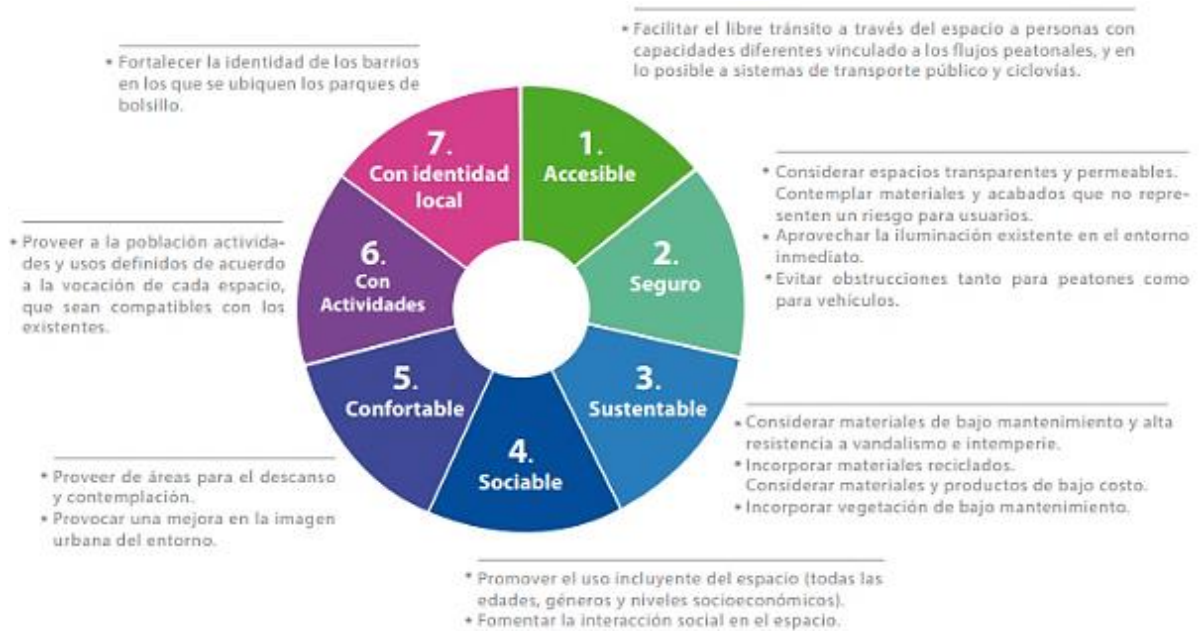
Figura 7. Consideraciones para un buen parque de bolsillo.