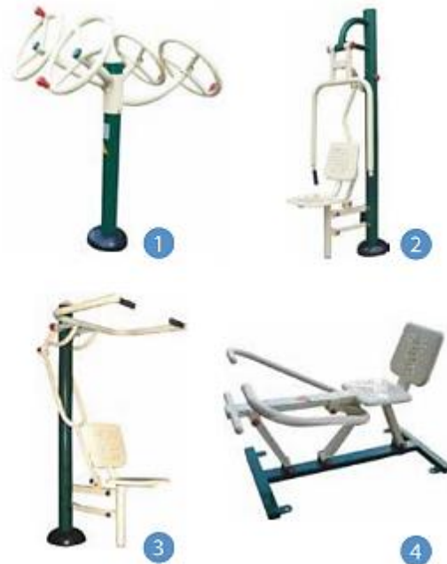
Figura 20. Gym.