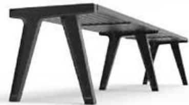
Diseño: Ariel Rojo