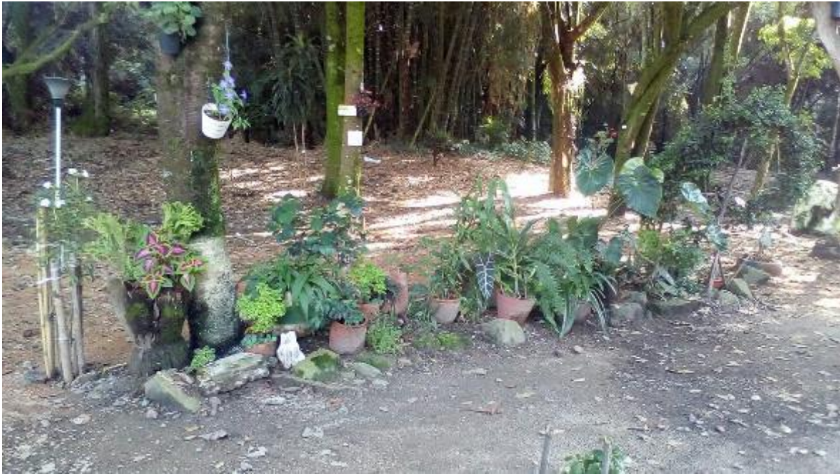
Figura 6. Participación de la comunidad en la siembra y manutención de la vegetación.