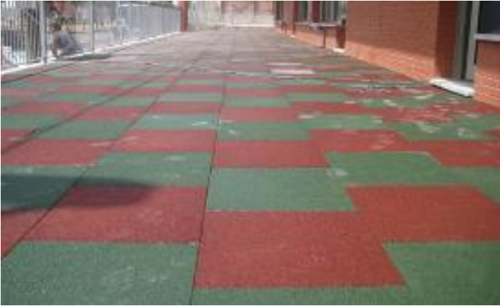
Figura 12. Ejemplo de loseta instalada.