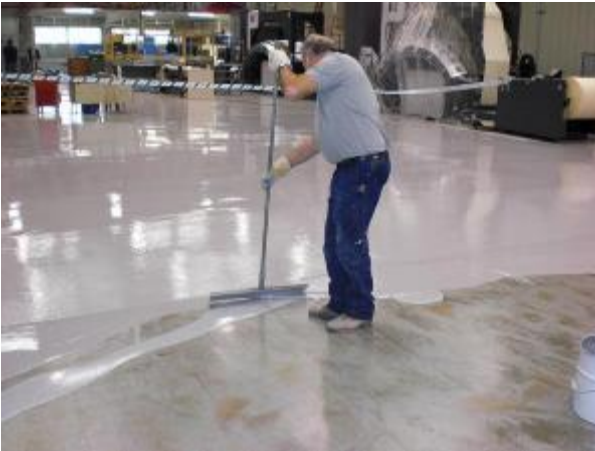
Figura 9. Resina hormigón impreso.