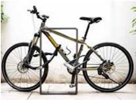
Industrias Fresser de México, S.A. de C.V.