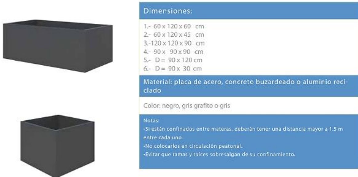
Figura 18. Contenedores vegetales.