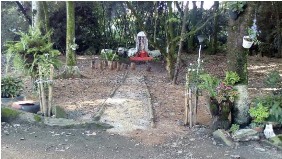
Figura 5. Virgen desde la fachada principal del lote.