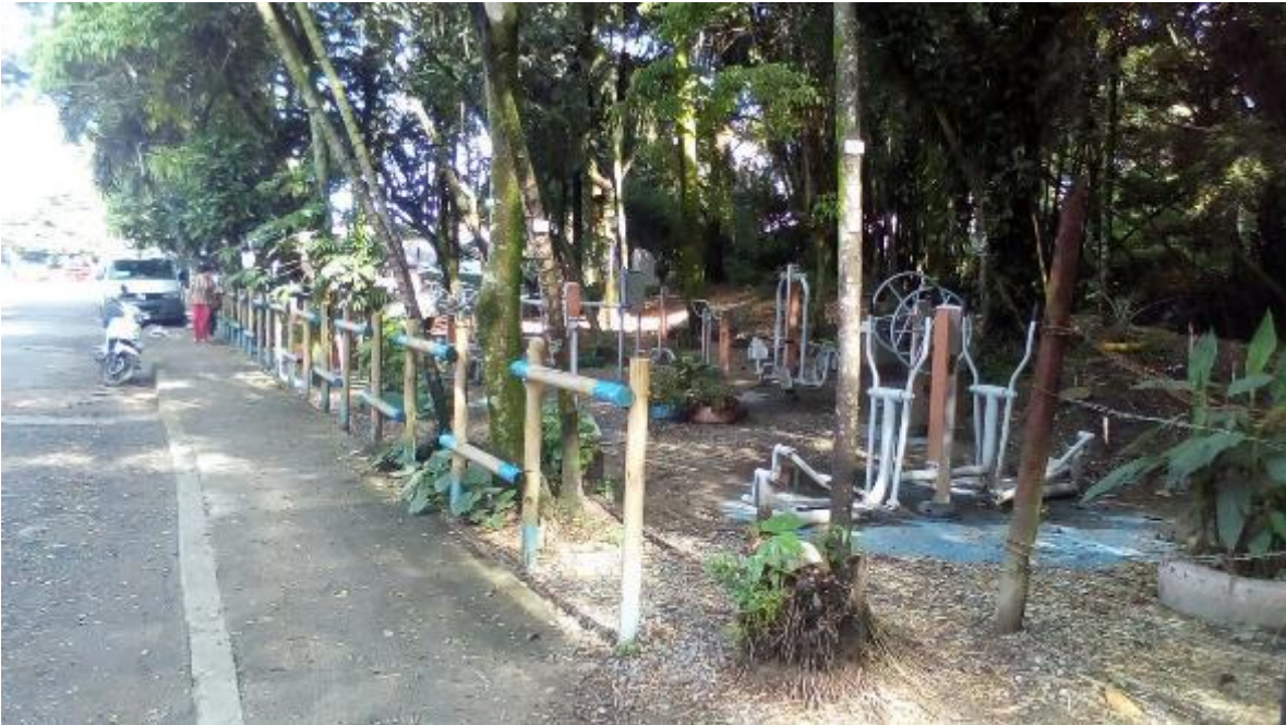
Figura 2. Gimnasio al aire libre, cerca al lote.