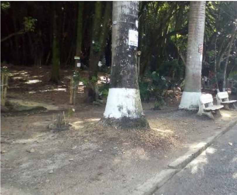
Figura 8. Palmeras, bambú o guadua y demás árboles como ceibas.

En la parte ambiental el tipo de árboles que predominan la zona, lugares de desechos de basuras, y sus manejos si existe contaminación visual ruido, sombras, vientos, sensaciones olores entre otros.