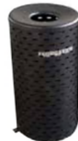
Figura 17. Canecas de basura.

Colocar un par de botes por cada 200 m 2 de parque