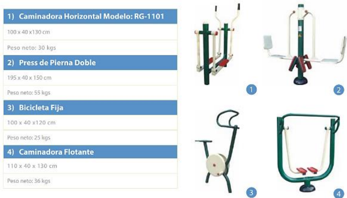
Figura 22. Gym.