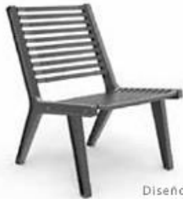
Diseño: Ariel Rojo