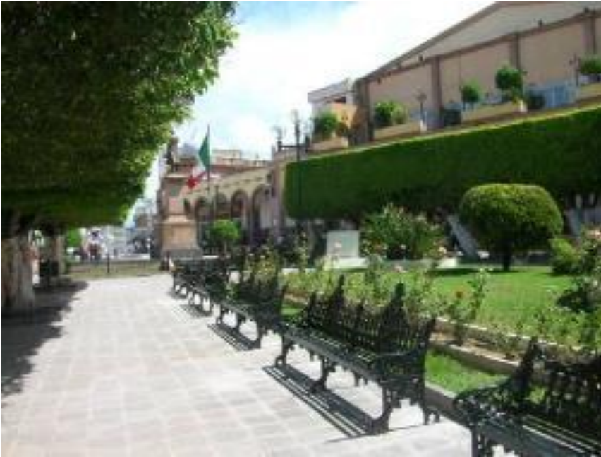
Figura 11. Centro histórico rehabilitado. Área ajardinada tras Monumento a Hidalgo.