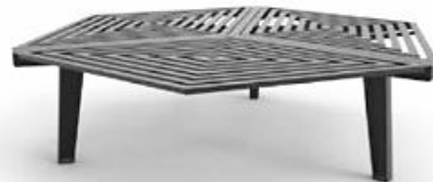
Diseño: Ariel Rojo

Color: negro , gris grafito, verde claro, azul cielo, naranja