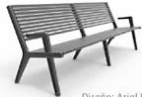
Diseño: Ariel Rojo