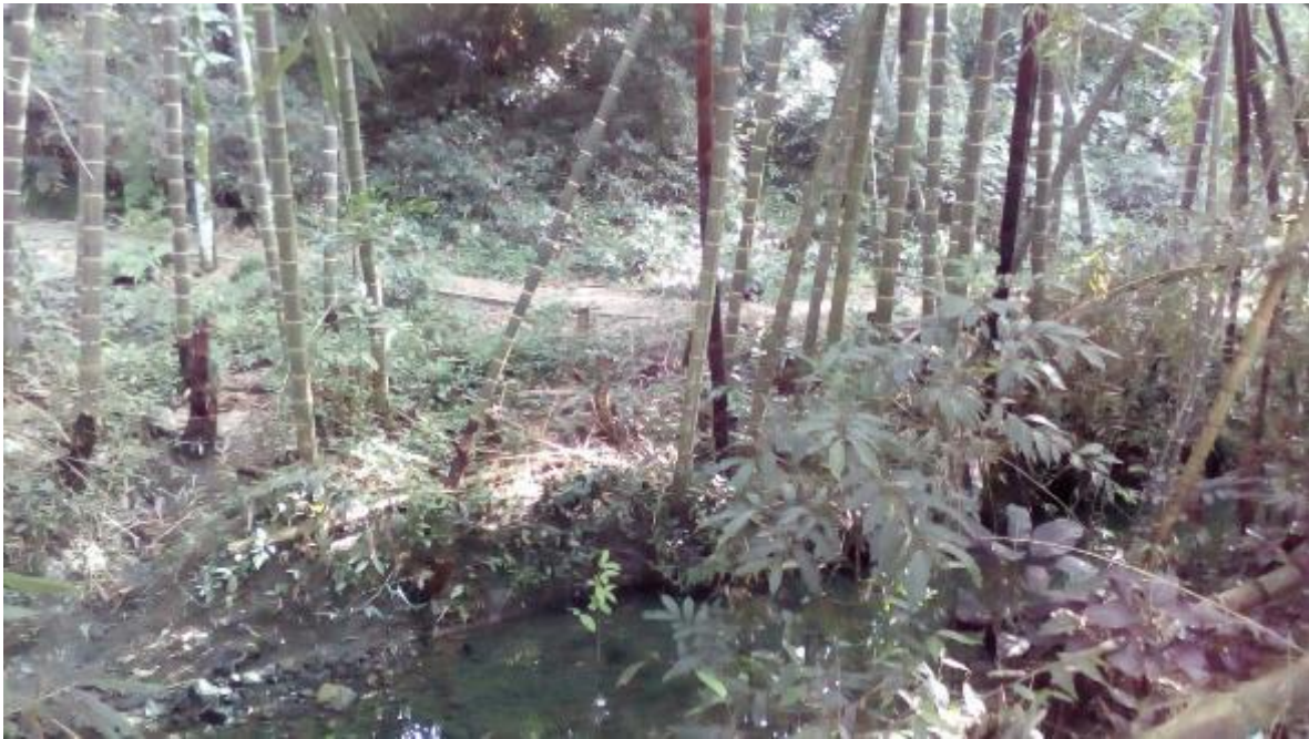
Figura 4. Quebrada Hato de la Virgen.