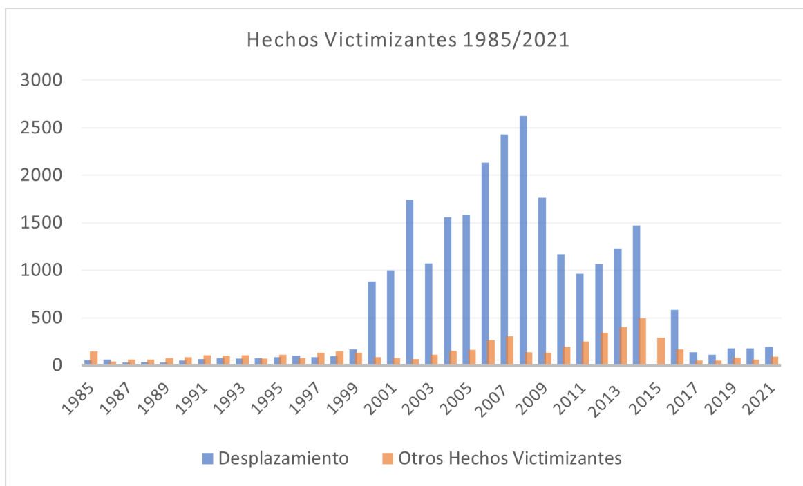
Imagen 3: elaboración propia 2022, a partir de los datos del Registro Único de víctimas.

Concluyendo el estudio de los datos del DANE, se inicia la indagación de las cifras de población desplazada y otros hechos victimizantes (combates, hostigamientos, actos terroristas, homicidio abandono o despojo forzado de tierras, entre otros) en el Registro Único de Víctimas, entre los años 1985 y 2021. Con los datos recolectados se elabora la siguiente gráfica: