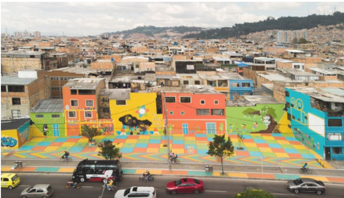
Figura 1. Suba- Nuestro Jardín-Nerio Guevara.

En este sentido, esta problemática se basa en la teoría de género y se inscribe en sobre dos paradigmas, el teórico histórico-crítico y el cultural del feminismo (Lagarde, 1996), además de ser herramienta de gestión que permite reconocer y abordar desigualdades y barreras que enfrentan las mujeres en el acceso y uso de los espacios públicos. Lo anterior, enuncia la necesidad de crear entornos más seguros, accesibles e inclusivos, donde las mujeres puedan moverse libremente sin temor a la violencia o la discriminación, convirtiéndose en herramienta analítica útil para impulsar programas que promuevan el desarrollo dentro de un marco normativo de protección, equidad y responsabilidad social.