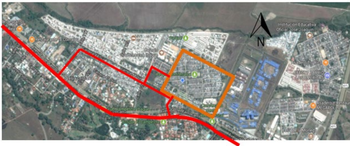
Figura 1. Plano de localización del recorrido.

El sector a analizar está ubicado en la comuna 9 de Ibagué, es el barrio Ciudadela Comfenalco, está conformado por 4 etapas con alrededor de 2250 viviendas y 7500 habitantes.