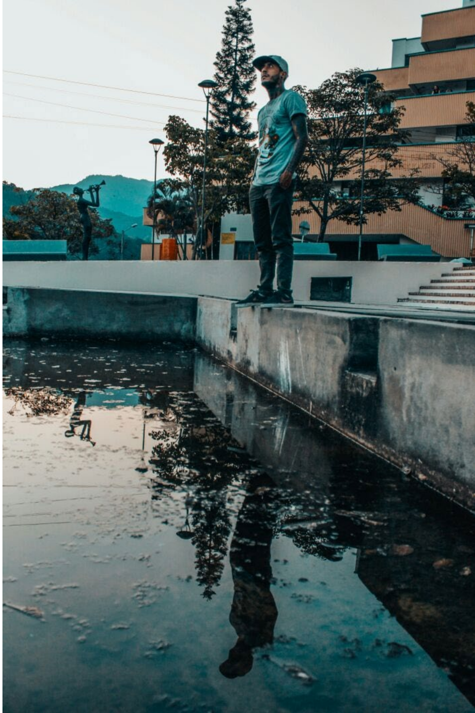
Figura 1. Espejo de agua del Parque de la Música con el edificio bolivariano del Conservatorio del Tolima, al fondo.