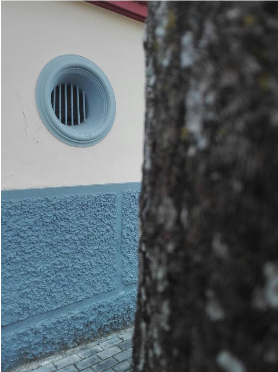
Figura 9. Vano del sótano de la sala de conciertos Alberto Castilla, desde el Parque de la Música.