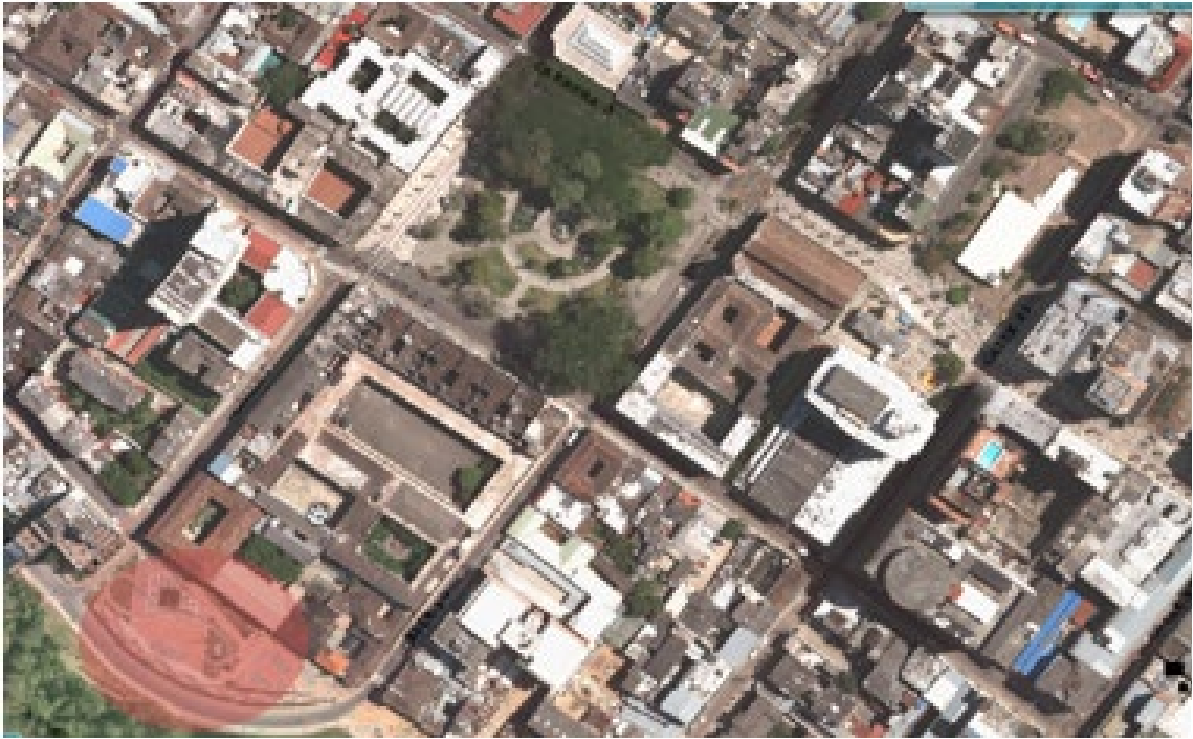
Figura 3. Localización del parque de la Música

Tolima y el salón Alberto Castilla, además de tener visuales dirigidas hacia el cañón del Combeima y estar cercano al cauce del río Combeima.