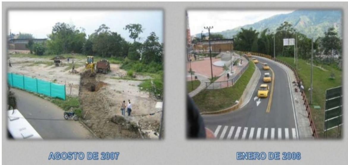
Figura 5. Imágenes proceso de construcción (pág. Slideshare; constructora Bonilla)

Su diseño hace alusión a las notas del pentagrama, además de jugar con texturas diagonales que enmarcan los espacios y generan retículas diagonales, con la topografía se hace un manejo de gradas que tienen la visual dirigida hacia un pequeño escenario en proporción del parque, se limita o se obvia la visual hacia el cañón desde la parte baja del parque. El uso del parque se torna para centro de exposiciones y de expresión artística, además la fuente diseñada como uno de los principales atractivos del parque se activaba con el ritmo de la música creando así un espectáculo de luces y agua.