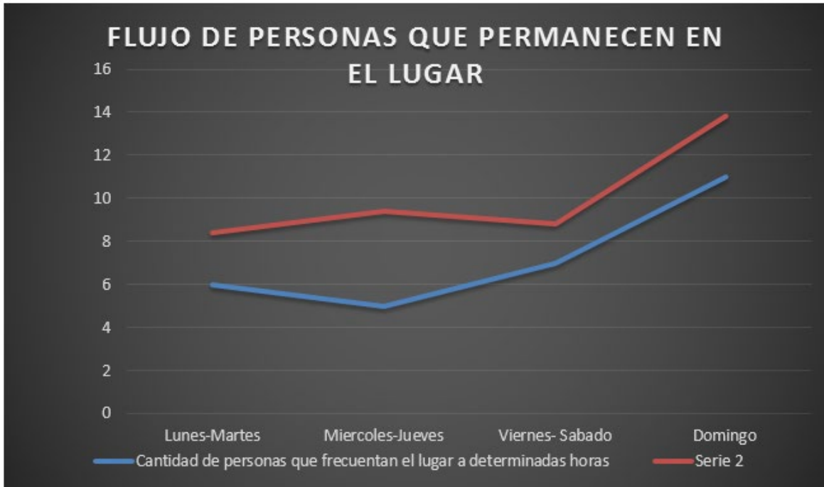
Figura 8. Flujos y permanencias en el Parque de la Música.

Es un parque de fácil acceso, pero en una zona donde carece la seguridad y, por lo tanto, después de ciertas horas no es seguro transitar o permanecer en el parque por mucho tiempo.