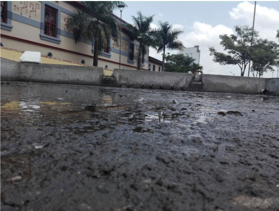
Figura 2. Falta de mantenimiento en el Parque de la Música.

Por lo que finalmente lo que se busca con este artículo es hacer una reflexión además de desarrollar, evaluar y aplicar mediante estrategias acogidas en diferentes lugares de Colombia y el mundo, como implementar planes que conlleven a un adecuado y buen funcionamiento del parque por parte de los habitantes, además de generar un potencial sitio turístico en la ciudad.