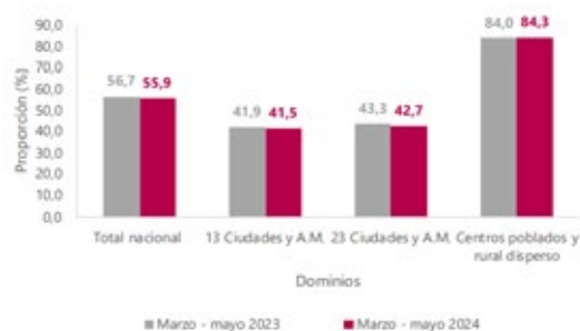
Gráfico 1. Proporción de población ocupada informal Total nacional, 13, 23 Ciudades y A.M. y centros poblados y rural disperso Trimestre móvil marzo - mayo (2023-2024)

máxime cuando el DANE reporta a marzo - mayo de 2024. Para ello veamos las tablas 2 y 3.