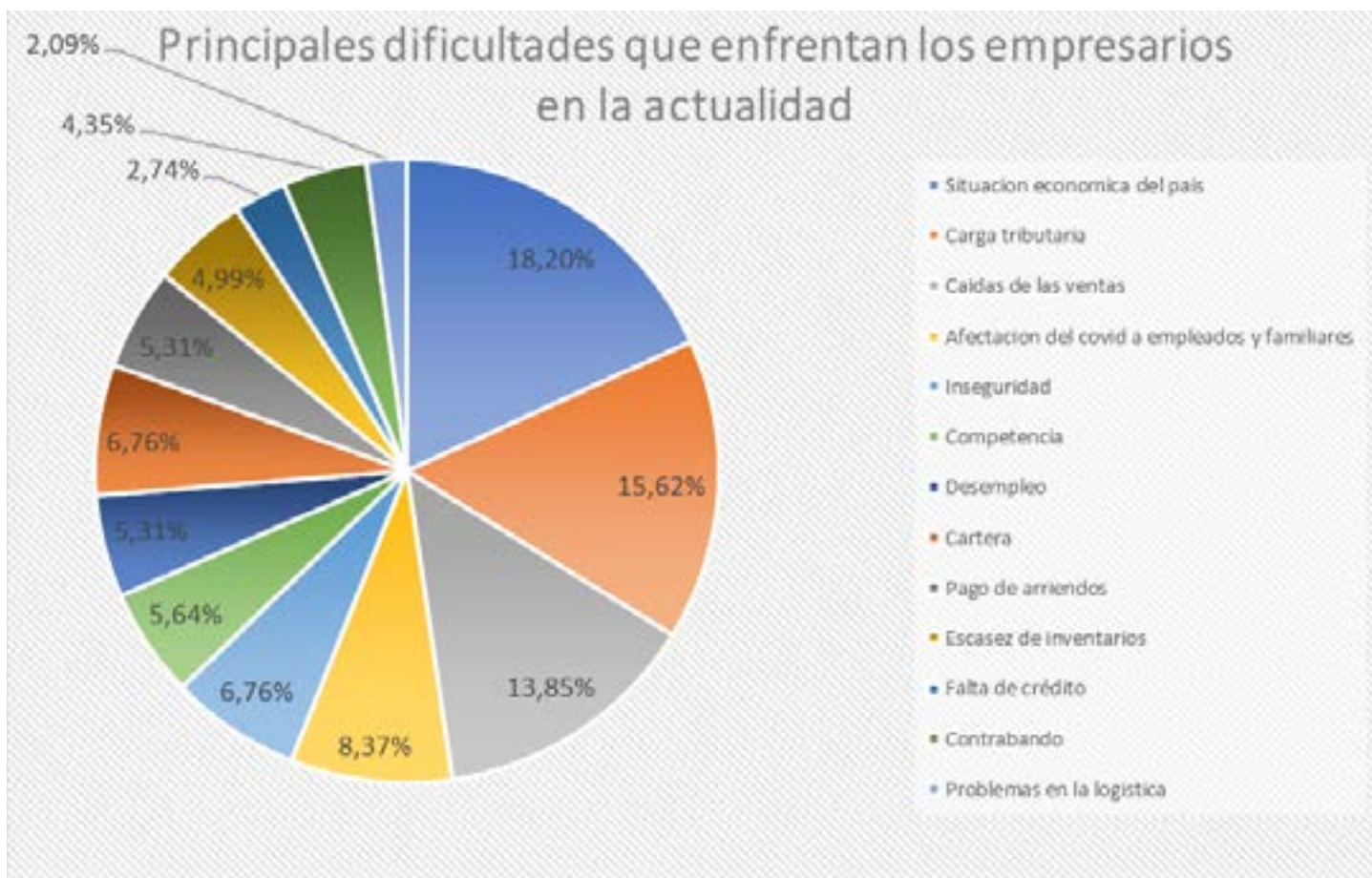
Figura 3 Principales dificultades que enfrentan los empresarios en la actualidad (febrero 2021).