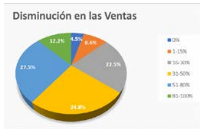
Figura 1 Disminución de ventas en las cuarentenas estrictas en Bogotá.