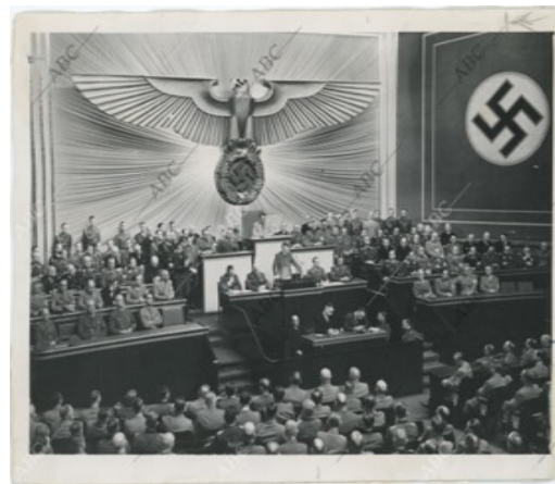
Archivo ABC, 1939 "Hitler pronuncia su histórico discurso en la sesión del Reichstag en el Kroll". Fotografía extraída del Archivo ABC.

Por último, cabe resaltar la posición decadente de las mujeres durante este siglo, sobre todo a las mujeres judías que fueron brutalmente segregadas y privadas de sus rasgos femeninos y su identidad. La guerra y autoritarismo que las dejó en una posición peor que a los mismos hombres ya que eran víctimas de actos de lesa humanidad, violencia física (violadas, golpeadas) y psicológica. E incluso hasta las mismas mujeres alemanas asesinadas y cruelmente violadas por el simple hecho de pertenecer a una postura distinta (etnia, credo, ideología).