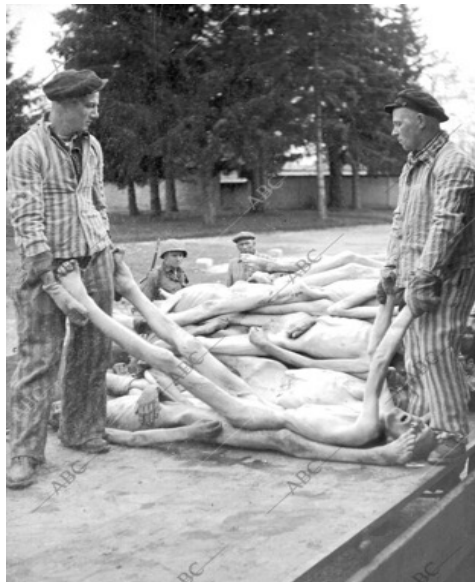
Archivo ABC, 1945 "unos prisioneros trasladan cadáveres de muertos en el campo de concentración"