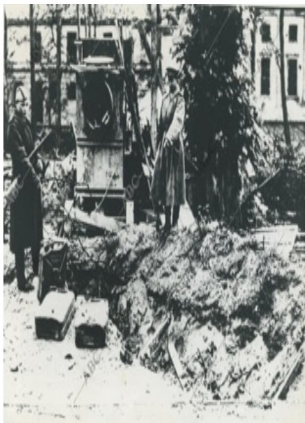
Soldados soviéticos posan ante la pila de tierra donde se suicidó Adolf Hitler con Eva Braun, en la entrada del búnker. (1945) Berlín Alemania.