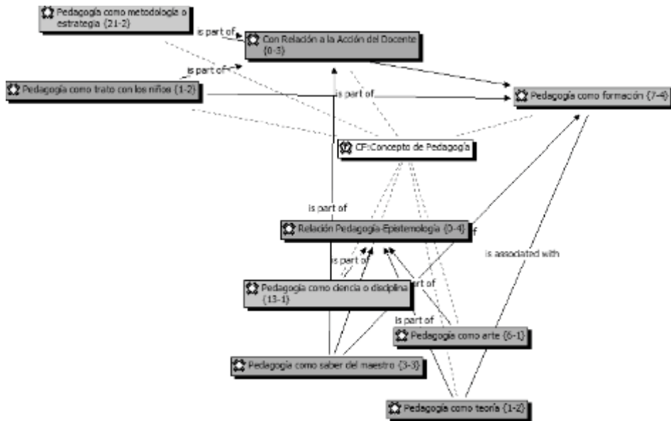
Figura 2. Red semántica. (Fuente: los autores).

El 40% de los docentes relaciona el concepto de pedagogía con metodologías o estrategias empleadas por el docente en el aula de clase; el 26% sostiene que es una ciencia o una disciplina; el 12% lo define como arte y como formación; en menor proporción aparecen conceptos vinculados con el saber del maestro con un 6% y con la teoría con un 2%. Aunque la concepción más representativa es asumirla como metodología o estrategia, consideramos importantes las concepciones de teoría, saber del maestro y ciencia o disciplina, dadas las discusiones epistemológicas actuales frente a este concepto.